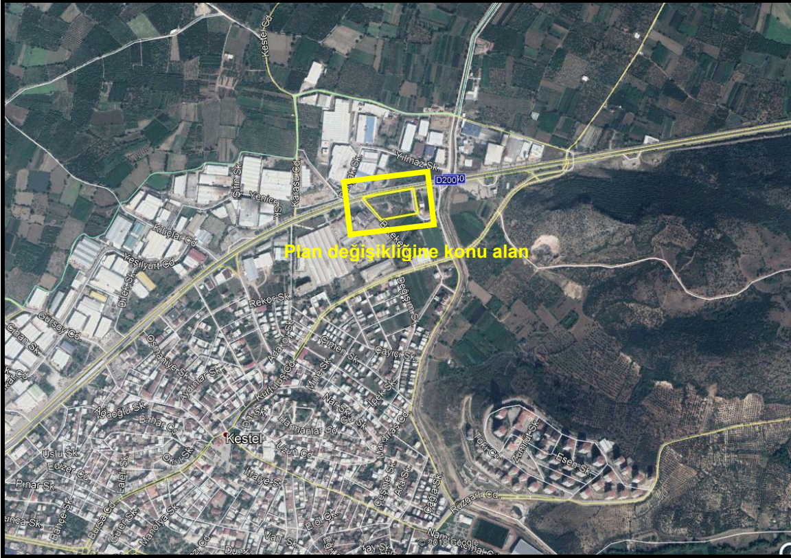
Şekil 1: Plan Değişikliğine Konu Alanın Konumu

Plan değişikliğine konu Kestel İlçesi, Kale Mahallesi, 119 Ada, 3-4-7-8-10-11 Nolu Parseller, Merkez Planlama Bölgesi 1/25000 Ölçekli Nazım İmar Planı Revizyonu kapsamında kalmaktadır.