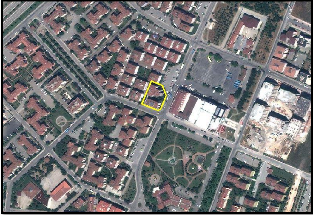
Resim.1- Uydu Görüntüsü

Bursa İli, Nilüfer İlçesi, Ataevler Mahallesi'nde bulunan yaklaşık 1.646 m 2 büyüklüğünde olan planlama alanı yakın çevresinde ağırlıklı olarak konut alanları, sağlık alanları, yeşil alanlar ve eğitim alanları bulunmaktadır.