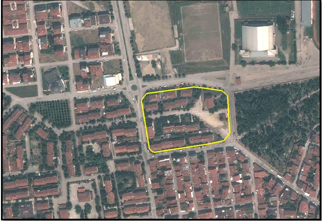
Resim.1- Uydu Görüntüsü

Bursa İli, İnegöl İlçesi, Burhaniye Mahallesi'nde bulunan yaklaşık 14.769 m 2 büyüklüğünde olan planlama alanı yakın çevresinde ağırlıklı olarak konut alanları, sağlık alanları, yeşil alanlar ve eğitim alanları bulunmaktadır.