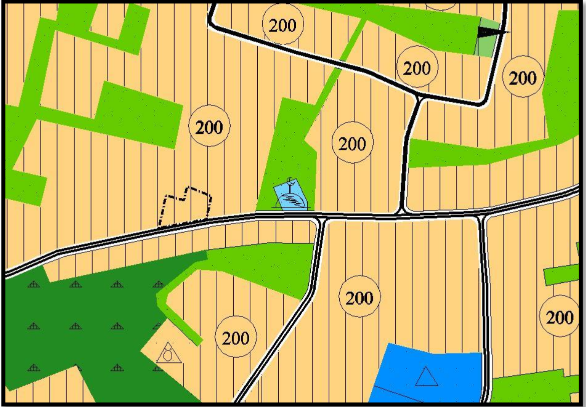
Harita.2- 1/5000 Ölçekli Nazım İmar Planı Değişikliği

Hazırlanan imar planı değişikliği ile söz konusu parselin Bursa Büyükşehir Belediye Meclisi'nin 20.06.2017 tarih ve 2010 sayılı kararı ile onaylanan plan değişikliği ile tanımlanan "Ticaret-Konut Alanı" olan kullanım kararı 200 kişi/ha yoğunlukta "Meskûn Konut Alanı" olarak değiştirilmiştir.