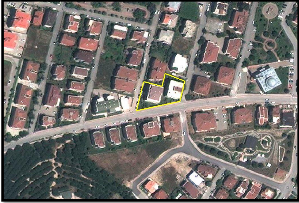
Resim.1- Uydu Görüntüsü

Bursa İli, Nilüfer İlçesi, Beşevler Mahallesi'nde bulunan yaklaşık 1.408 m 2 büyüklüğünde olan planlama alanı yakın çevresinde ağırlıklı olarak konut alanları, sağlık alanları, yeşil alanlar ve eğitim alanları bulunmaktadır.