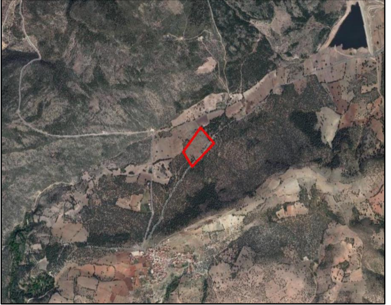
Şekil 1. Hava Fotoğrafi

Planlama alanı; Bursa İli, Büyükorhan Belediyesi sınırları içerisinde I21C-08B nolu nazım imar planı paftasına giren 102 ada 8 nolu parselde Yenilenebilir Enerji Kaynaklarına Dayalı Üretim Tesisleri Alanı (Biyokütle Enerjisine Dayalı Elektrik Üretim Santrali) önerilmesi ile ilgili yaklaşık 3.40 hektar büyüklüğünde bir alanda yapılan 1/5000 ölçekli Nazım İmar Planı işini kapsamaktadır(Şekil 1.).