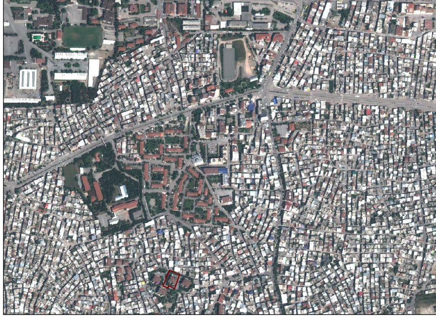
Resim.1- Uydu Görüntüsü

Değirmenlikazık Mahallesi Bursa Merkezinin doğusunda, Yıldırım Belediyesi sınırlarında bulunmaktadır. Plan değişikliği hazırlanan alan konumu itibarı ile parsel Eğitim Caddesi ve Tayyareci Mehmet Ali Caddesi arasında kalmakta olup, Akyüz-3 Sokak ile Çayır-5 Sokak'ın birleştiği kuzeybatı köşesinde yer almaktadır. Plan değişikliği hazırlanan parsel 4,732.80 m2 büyüklüğündedir.