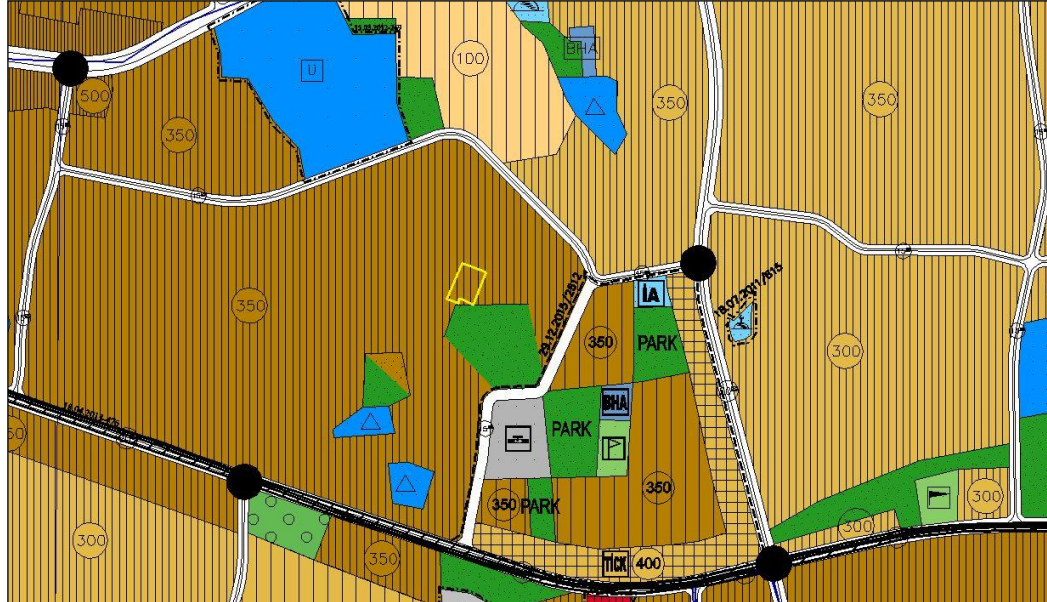
Harita.1- 1/5000 Ölçekli Nazım İmar Planı Durumu

Plan değişikliğine konu parsel 1/5000 ölçekli Yıldırım Nazım İmar Planı kapsamında kısmen 350 kişi/ha yoğunluklu "Meskûn Konut Alanı" ve kısmen "Park Alanı" olarak planlıdır.