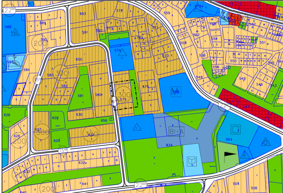
Harita.1- 1/5000 Ölçekli Nazım İmar Planı Durumu

Plan değişikliğine konu parsel Nilüfer Belediyesi 1/5000 Ölçekli Nazım İmar Planında söz konusu parsel “300 Ki/Ha Orta Yoğunlukta Meskun Konut Alanı” olarak planlıdır.