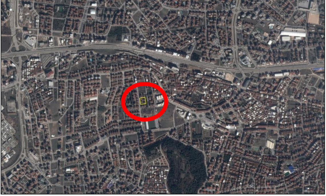
Resim.1- Uydu Görüntüsü

Plan değişikliğine konu 579 ada 2 parsel Nilüfer İlçesi, Beşevler Mahallesi'nde konumlanmaktadır. Parsel Beşevler Caddesi'nin 300 m batısında, Karafatma Heykeli'nin ise 500 m kuzeybatısında yer almaktadır. Plan değişikliğine konu 579 ada 2 parsel 3214 m2 büyüklüğündedir.