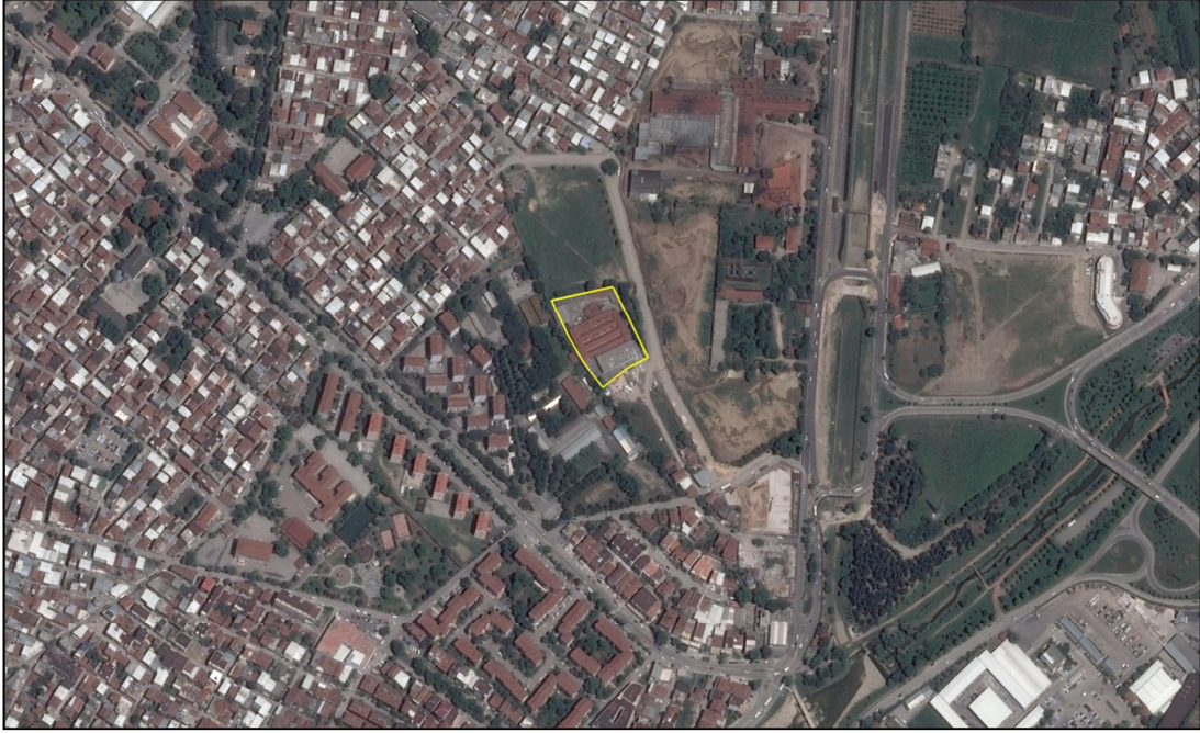
Resim.1- Uydu Görüntüsü

Hürriyet Caddesi'nin ise yaklaşık 170 m kuzeybatısında konumlanmaktadır. Parselin yakın çevresi zaman içerisinde konut alanları ile yapılaşmıştır. Plan değişikliğine konu alan 5833 m 2 büyüklüğündedir.