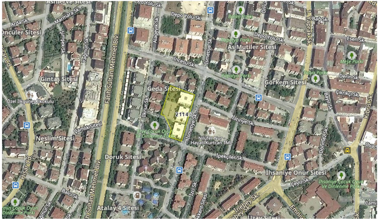
Planlama Alanının Bölge İçerisindeki Konumu

Bursa İli, Nilüfer İlçesi, İhsaniye Mahallesinde bulunan 5.084 m 2 büyüklüğünde olan planlama alanı yakın çevresinde planlı yapılaşmış 5-8 kat orta yaşlı site tipi yapılardan müteşekkil konut alanları bulunmaktadır. Genel olarak altyapı ve belediyecilik hizmetleri, sosyal donatı alanları yeterli seviyededir. Orta ve orta üst gelir grubuna hitap eden bölge merkezi konumda bulunmaktadır.