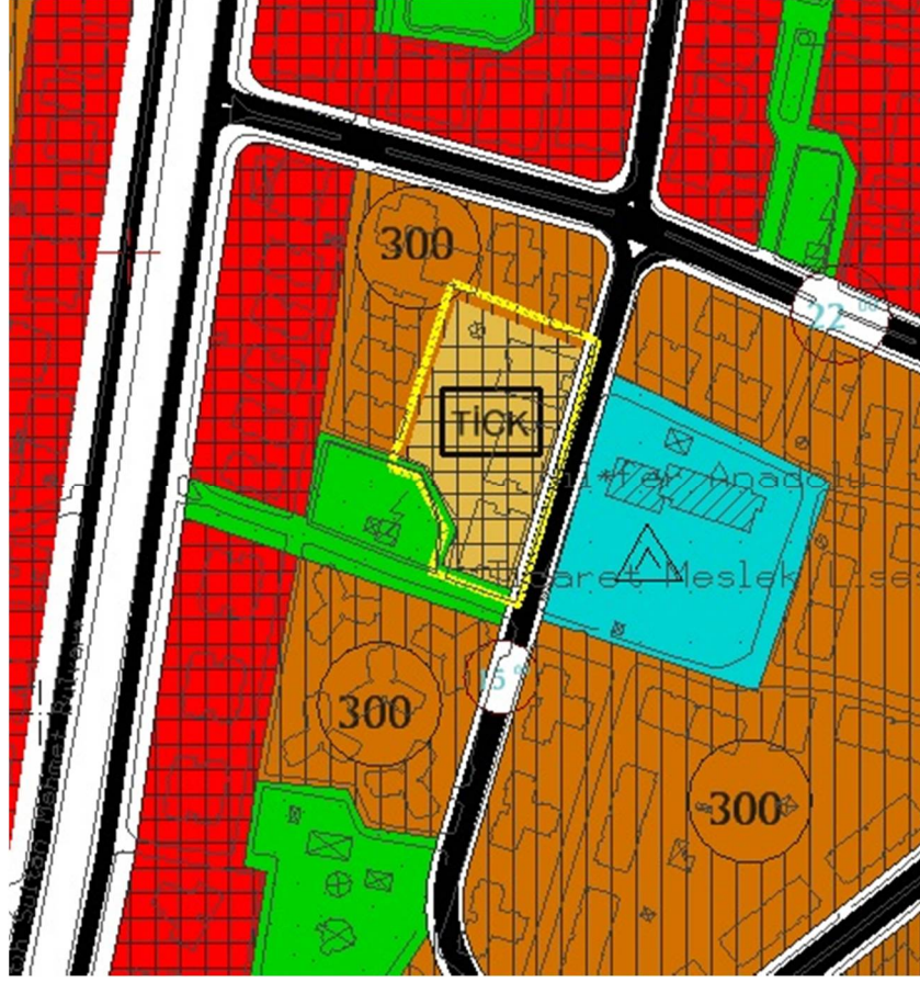
1/5000 ölçekli Nazım İmar Planı Durumu