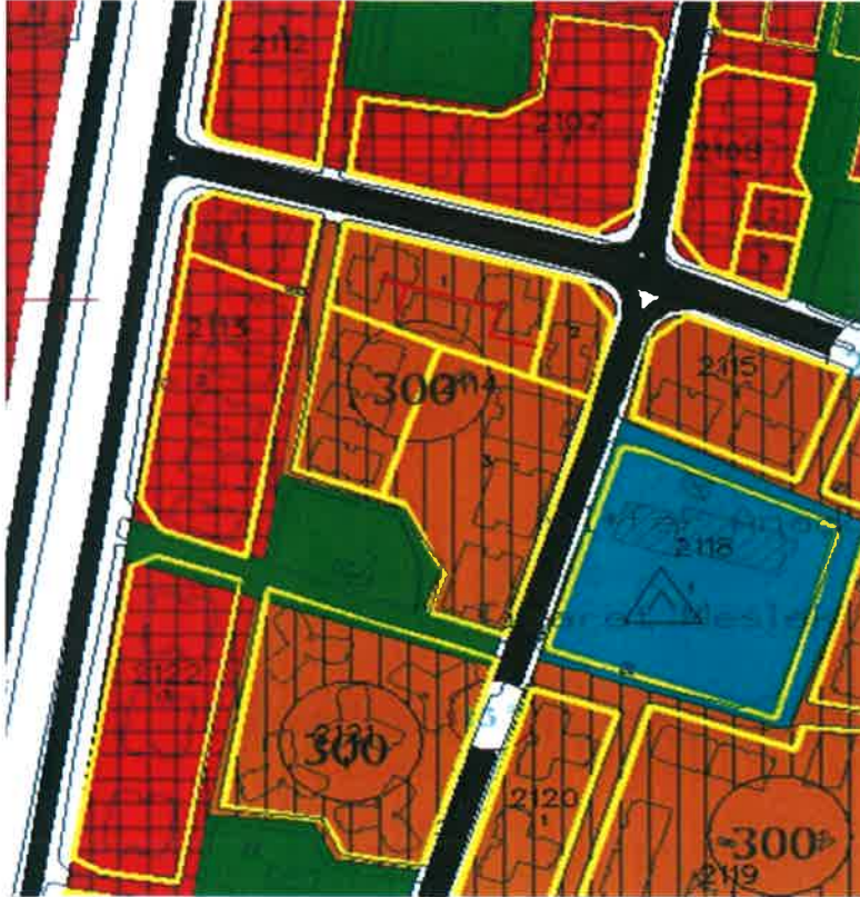
1/5000 ölçekli Nazım İmar Planı Durumu

Planlama alanına ait planlama kararları incelendiğinde 1/5000 Ölçekli Nazım İmar Planında planlama alanı 300 ki/ha Konut alanında kalmaktadır.