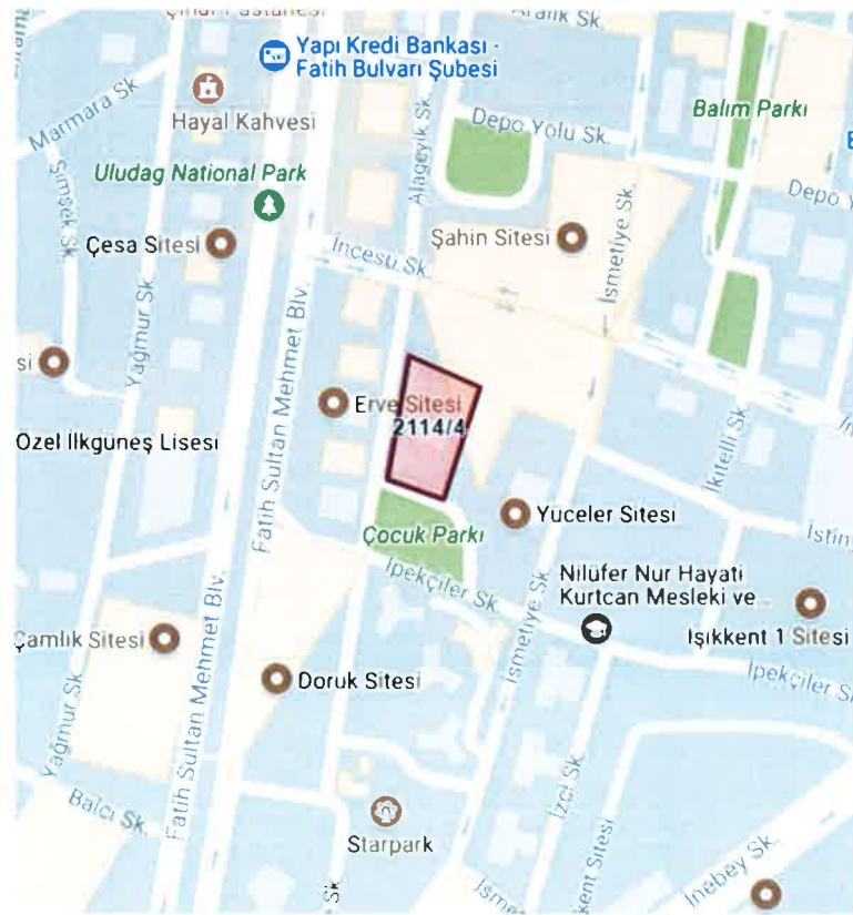
Planlama Alanının Ulaşım İlişkileri

Planlama alanına, Nilüfer İlçesinin en önemli ulaşım ve ticaret akslarından Fatih Sultan Mehmet Bulvarı , İncesu Sokak ve İpekçiler Sokak üzerinden ulaşılabilir. Fatih Sultan Mehmet Bulvarı'na yaklaşık 60m. , İncesu Sokak'a yaklaşık 72m. ve İpekçiler Sokak'a yaklaşık 42m. mesafede bulunan taşınmaz İlknur Sokak üzerindedir. Toplu ulaşım olanakları, ana arterlere yakın uzaklık açısından değerlendirildiğinde planlama alanı kolay ulaşılabilir niteliktedir.