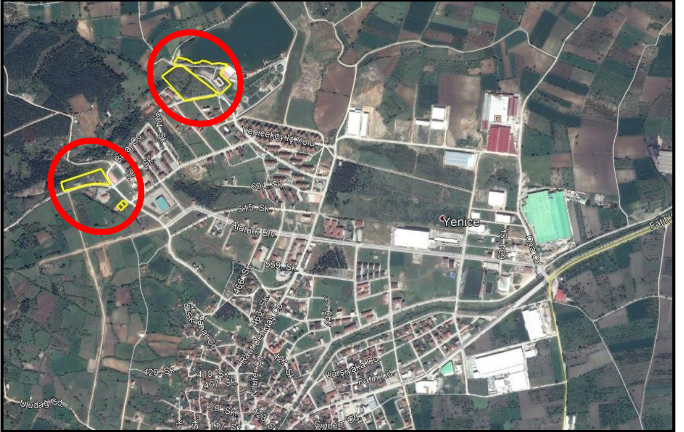
Sekil 1: Plan Değişikliğine Konu Alanların Konumu

Bursa İli, İnegöl İlçesi, Yeniceköy Mahallesi; 212 Ada, 6 ve 7 Nolu Parseller Mümin Gençoğlu Mahallesi Muhtarlığının 150 metre batısında konumlanmış olup, 500 Evler Caddesine cepheli, 213 Ada, 4 Nolu Parseller Mümin Gençoğlu Mahallesi Muhtarlığının 150 metre kuzeybatısında konumlanmış olup 500 Evler Caddesine cepheli, 372 Ada, 4 Nolu Parsel ile 599 Ada, 2 Nolu Parsel Atatürk Bulvarının 520 Metre kuzeyinde Yeniceköy Gölet Dinlenme Tesislerinin kuzeybatısında konumlanmış olup, taşıt yoluna cephelidir.