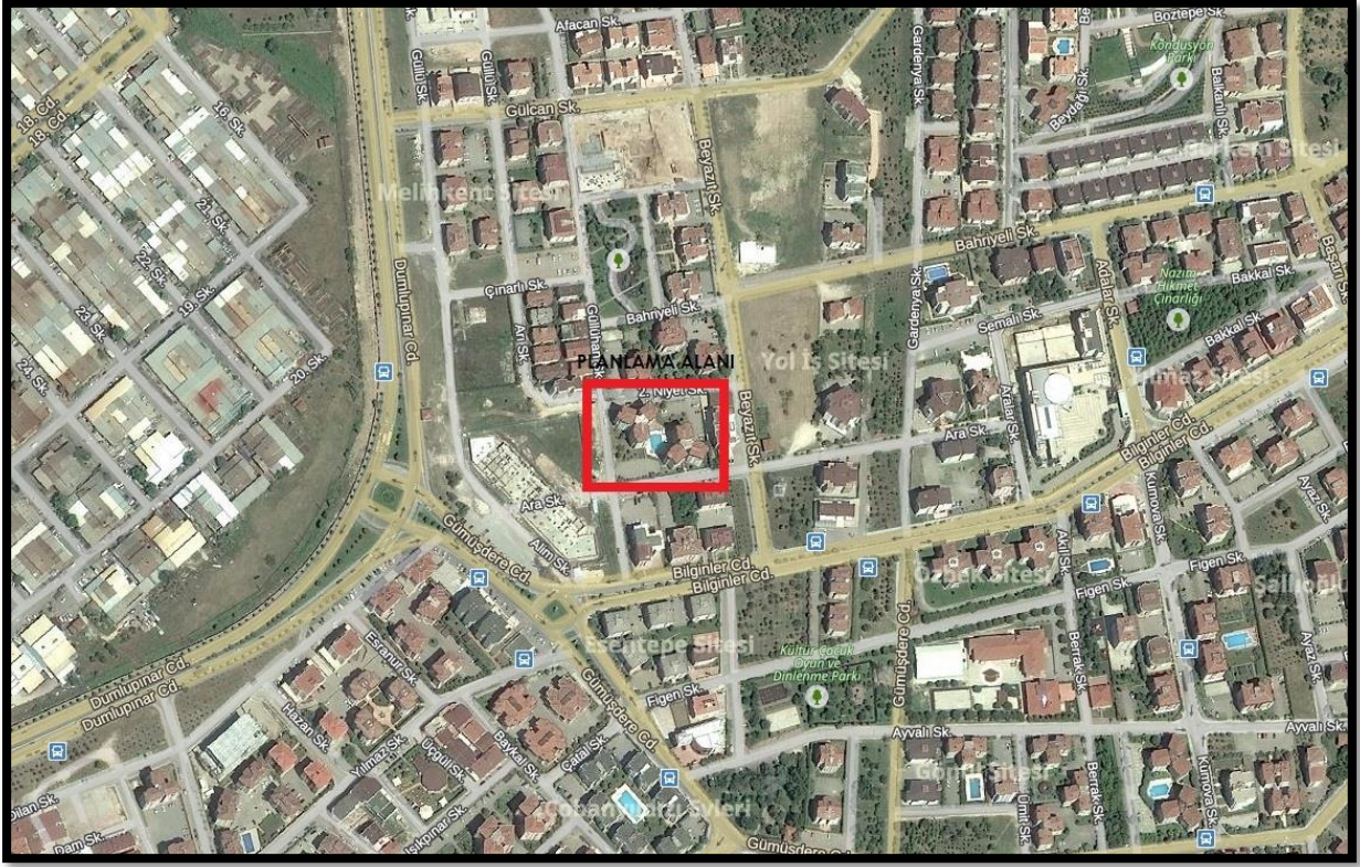
Şekil 2: Planlama Alanının Ulaşım İlişkileri