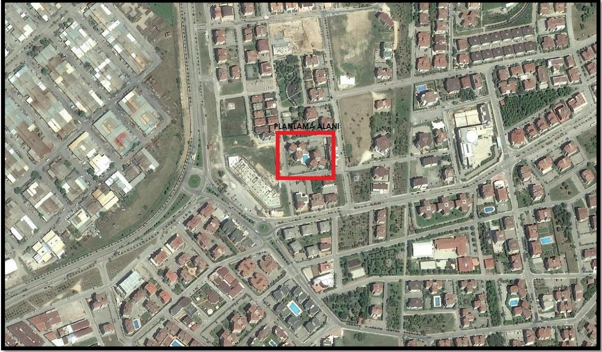
Şekil 1: Planlama Alanının Bölge İçerisindeki Konumu

Bursa İli, Nilüfer İlçesi, Beşevler Mahallesi'nde bulunan yaklaşık 4358,61 m 2 büyüklüğünde olan planlama alanı yakın çevresinde ağırlıklı olarak konut alanları bulunmakta olup, park ve küçük sanayi alanı da mevcuttur.