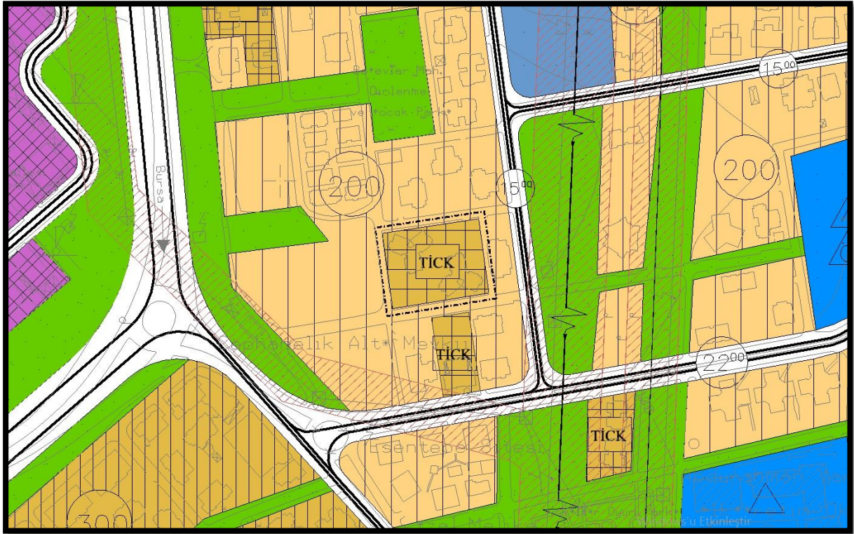
Şekil 5:718 Ada 1 Sayılı Parsele İlişkin 1/5000 Ölçekli Nazım İmar Planı Tadilatı

Bursa Büyükşehir Belediye Meclisi'nin 21.02.2017 tarih ve 458 sayılı kararıyla onaylanan plan değişikliği öncesinde planlama alanına ait parsel 1/5000 Ölçekli Nazım İmar Planında Konut Alanı imarlıdır. Parselde kentsel dönüşüm çalışması devam etmekte olup; planlama aşamasında 1/5000 ölçekli nazım imar planı değişikliği ile 1/1000 ölçekli uygulama imar planı değişikliği birlikte onaylanmıştır. Plan değişikliğine ilişkin mahkeme süreci devam etmekte olup, planlama hiyerarşisinin bozulmaması amacı ile parsel 1/5000 ölçekli nazım imar planında tekrar Ticaret-Konut Alanı olarak planlanmıştır. Yapılan değişiklik mevzuat açısından uygunluk taşımaktadır.