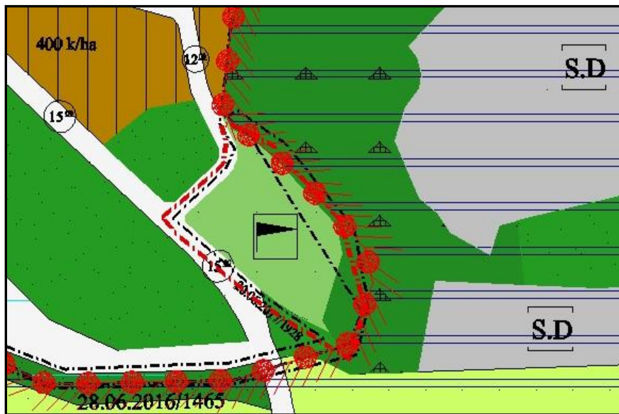
Resim 1: Onaylı 1/5000 Ölçekli Yıldırım Nazım İmar Planı

Plan değişikliğine konu olan alan üst ölçekli plan olan 1/5000 Ölçekli Yıldırım Nazım İmar Planında, Karapınar Mahallesi, 7271 ada, 64 parsel “Spor Tesis Alanı”nda kalmaktadır.