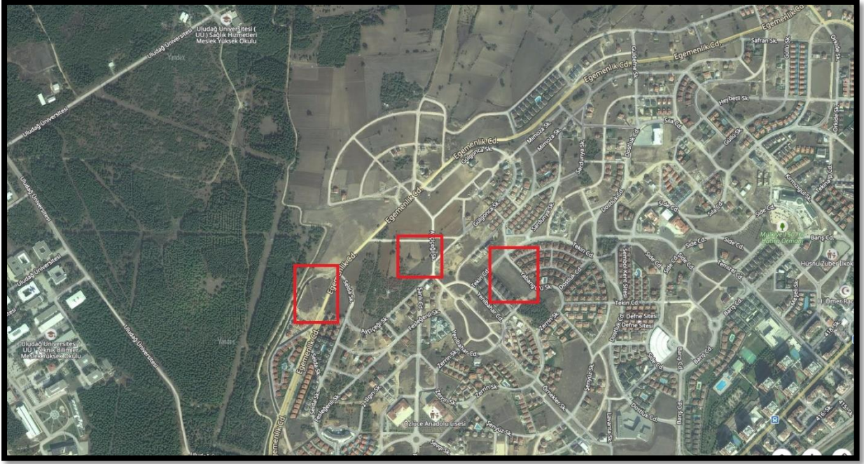
Şekil 2: Planlama Alanının Ulaşım İlişkileri