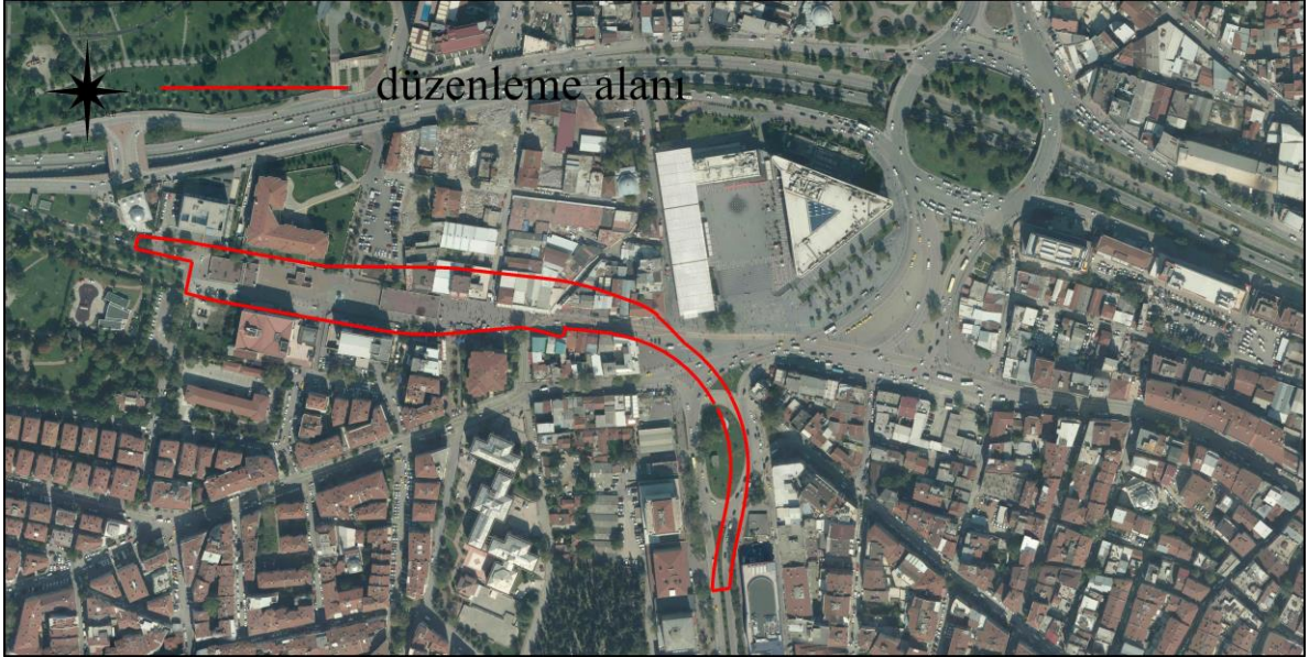
Şekil.1. Düzenleme Alanı Uydu Görüntüsü 2016

Raylı Sistemler Şube Müdürlüğü' nün 08.02.2018 gün ve 28406 sayılı yazısı ile; Kent meydanı Osmangazi istasyonunun raylı sistem hatları arasında entegrasyonu sağlayacak ve yolcu aktarmalarına imkan verecek şekilde düzenlenmesine yönelik Başkanlık Makamı' nca yapılan değerlendirmeler sonucunda, Santral Garaj Aktarma İstasyonu imar planı değişikliğine gerek kalmadığı belirtilerek gereği talep edilmektedir.