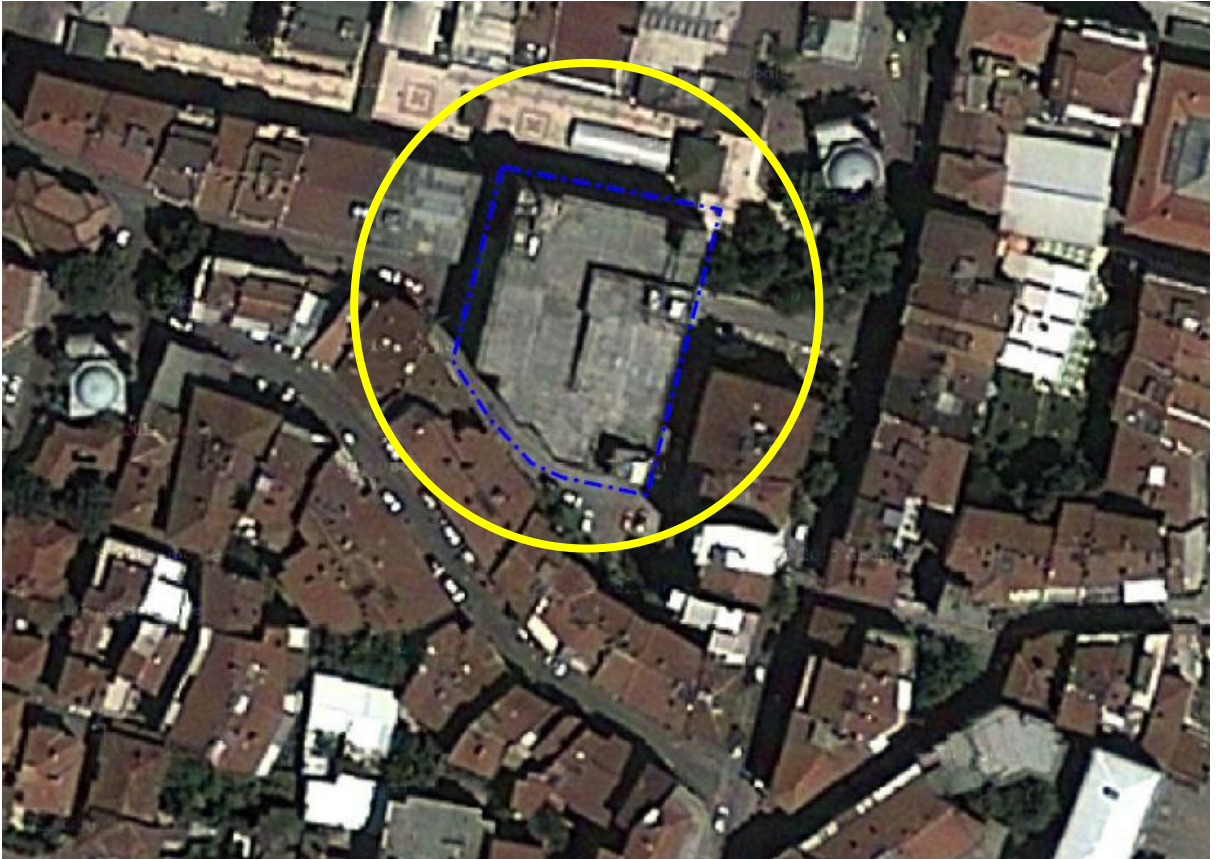
Resim 1: Alana ilişkin uydu görüntüsü

Plan değişikliğine konu alan yaklaşık 1474 m 2 olup, parselin tamamı Bursa Büyükşehir Belediyesi mülkiyetinden oluşmaktadır.