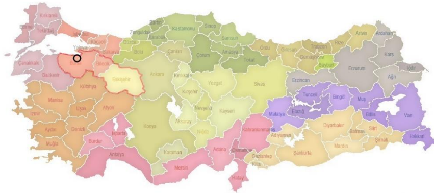
Harita.1- Türkiye'nin Coğrafi Bölge ve İBBS Haritası

Plan değişikliğine konu alanın yer aldığı Bursa ili kuzeyde Marmara Denizi ve Yalova İli, doğuda Bilecik İli, güneyde Kütahya İli ve batıda Balıkesir İli ile çevrilidir.