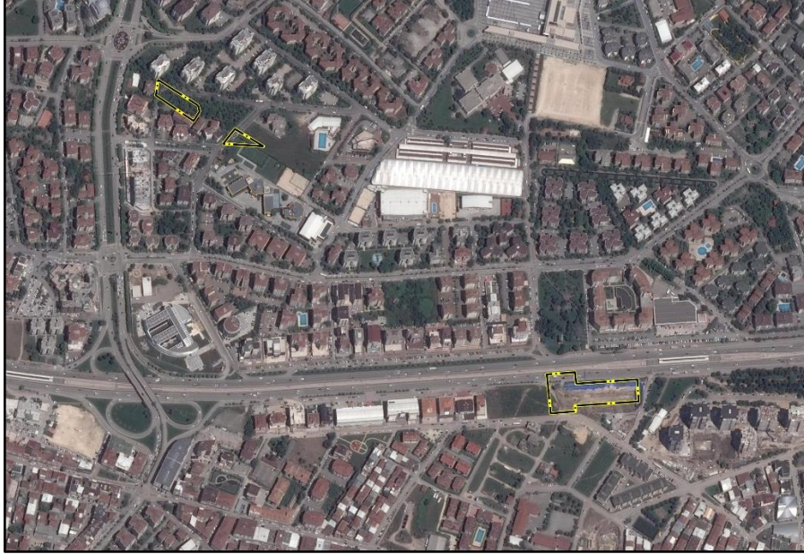
Resim.1- Uydu Görüntüsü

Plan değişikliği hazırlanan alan büyüklüğü toplamı 4931,15 m 2 büyüklüğündedir.