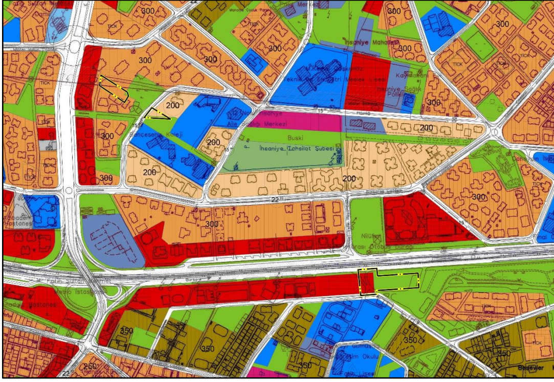
Harita.4- 1/5000 Ölçekli Nazım İmar Planı Değişikliği

Plan değişikliği ve öncesindeki alan kullanım büyüklükleri ve oranları şu şekildedir: