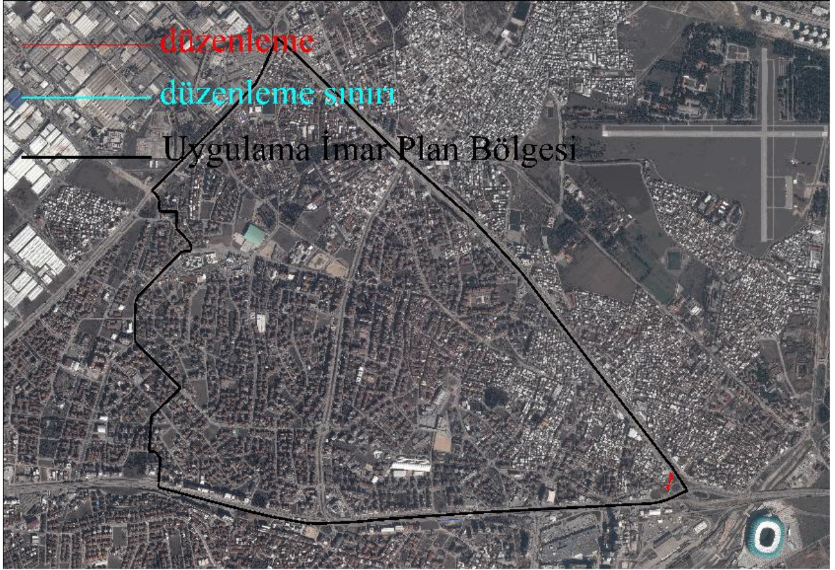
Düzenleme Alanı Uydu Görüntüsü 2016

İli :BURSA İlçe :Nilüfer Mahallesi :Karaman Mevcut Planlar :Bursa İli Nilüfer İlçesi, Fethiye İhsaniye Revizyonu Uygulama İmar Planı