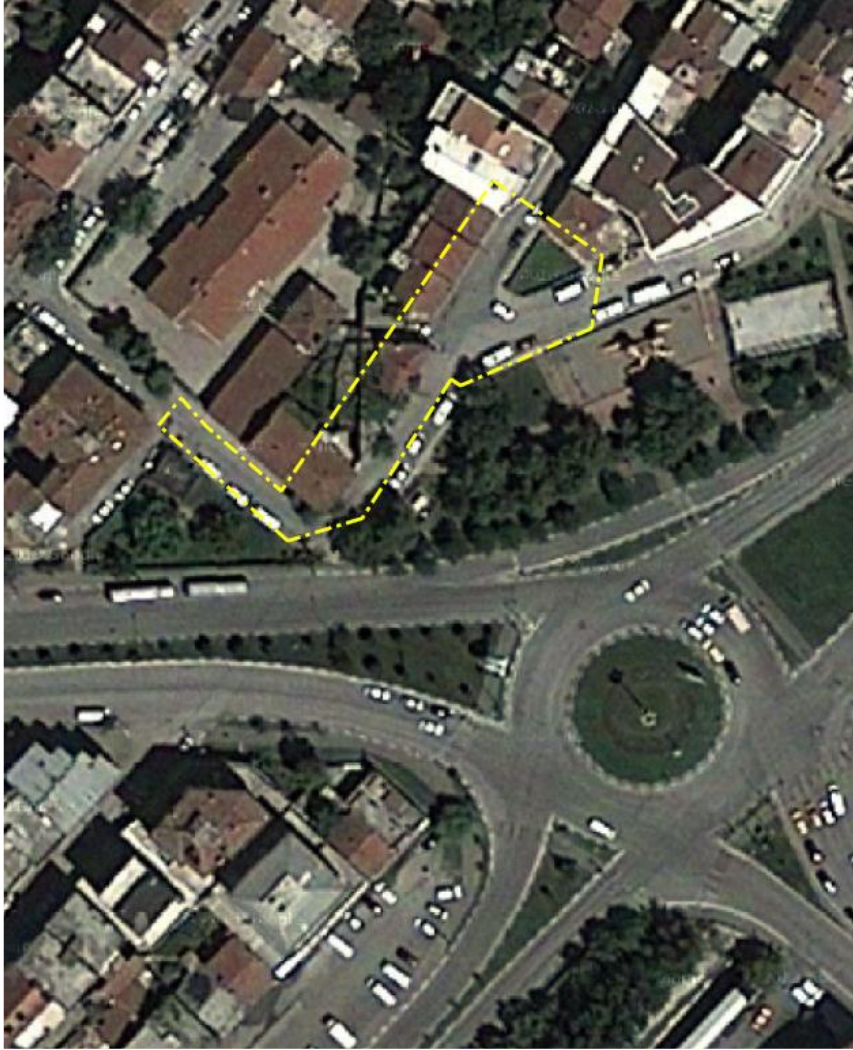
Resim 1: Alana ilişkin uydu görüntüsü

Plan değişikliğine konu alan yaklaşık 925 m 2 olup, parselin bir kısmı maliye hazinesi, bir kısmı büyükşehir belediyesinin mülkiyetindedir.