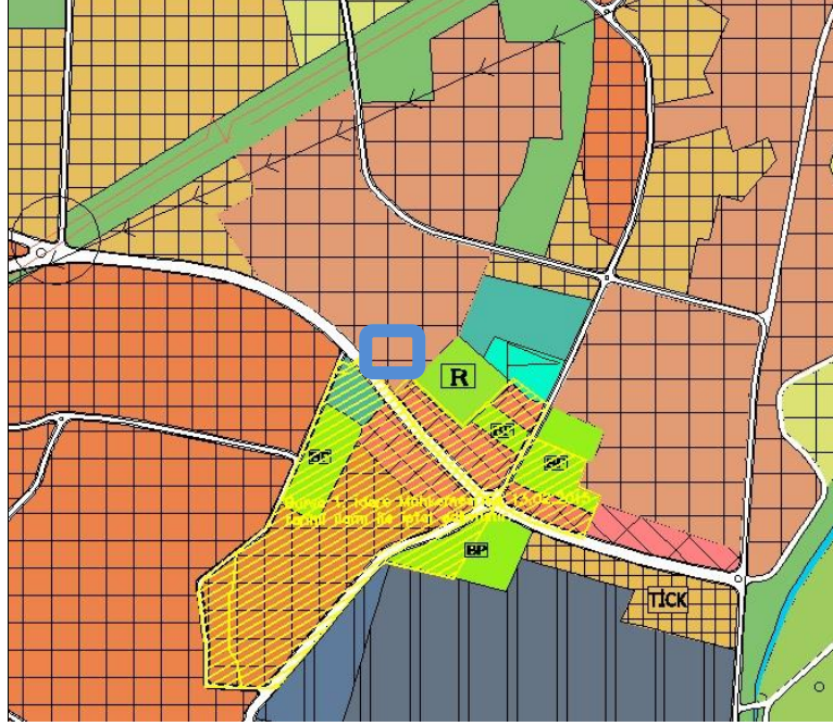
Yürürlükteki Bursa Büyükşehir Belediyesi Merkez Planlama Bölgesi 1/25000 Ölçekli NİP Revizyonu Örneği