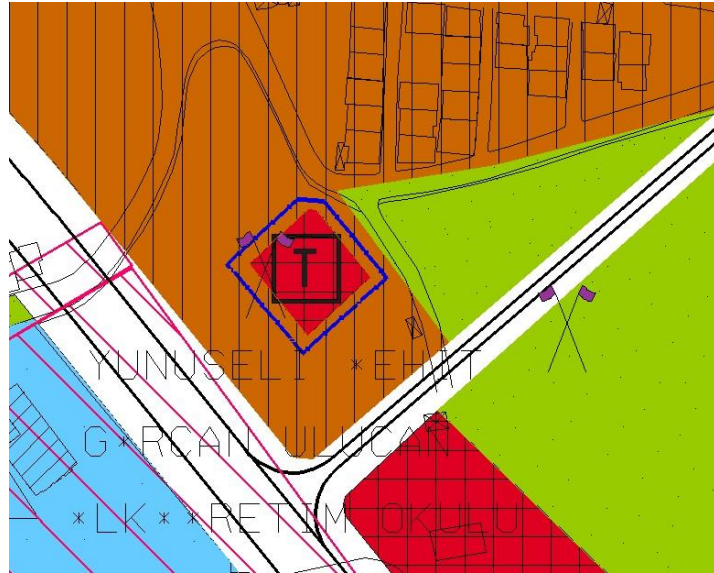
1/5000 Ölçekli Osmangazi Nazım İmar Planı Plan Değişikliği

Bursa İli, Osmangazi İlçesi, Yunuseli Mahallesi sınırlarında kâin ve tapunun H22d01a pafta, 7372 ada 1 parsel de kayıtlı taşınmazlara ait 1/5000 Ölçekli Osmangazi Nazım İmar Planı Plan Değişikliği ile yürürlükteki “ Mevcut Konut Alanı ” olarak tanımlı alan kullanım kararları yapılan plan değişikliği ile birlikte “ Ticaret Alanı ” olarak yeniden düzenlenmiştir.