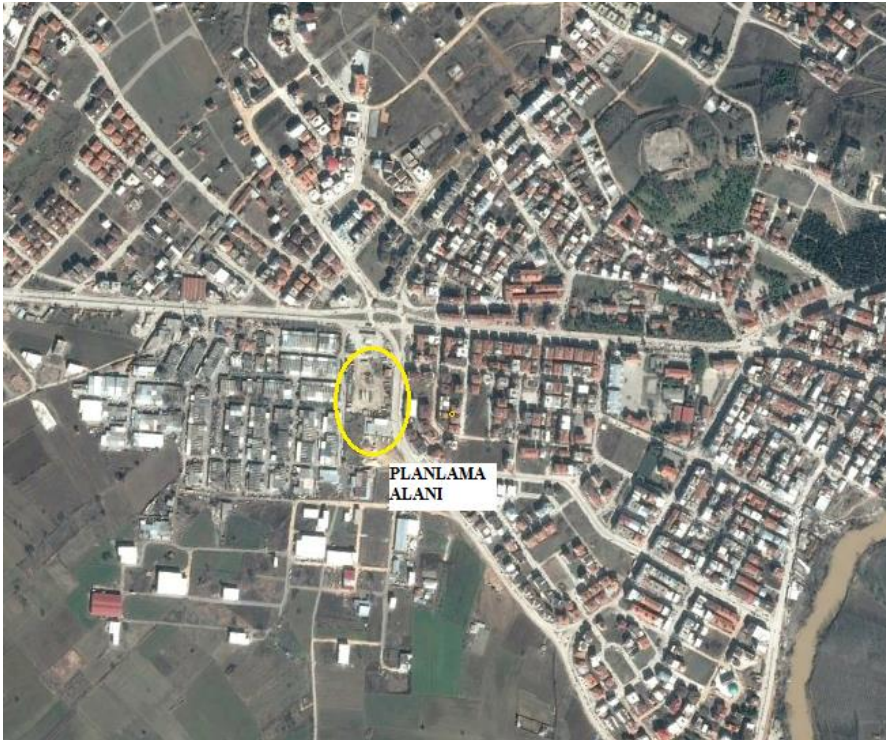
Planlama alanı

Alan kuzeyinden geçen Atatürk Bulvarına 70 m mesafede olup planlama alanının ana ulaşımı 30 m bu yoldan sağlanmaktadır.