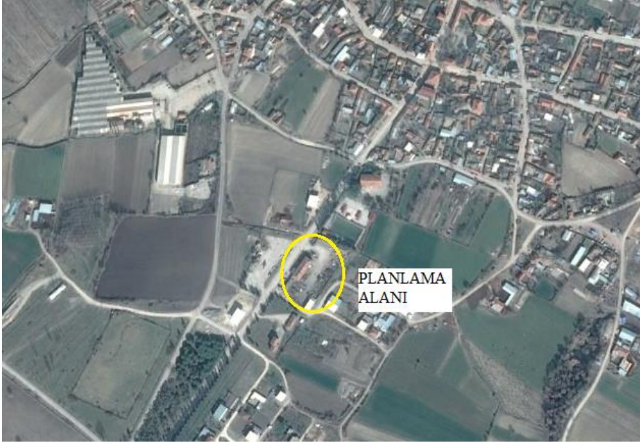
Planlama alanı (Google earth'den alınmıştır)

Alanın eğimi %5'in altında olup düz bir topografyaya sahiptir. Parsel büyük ölçüde boş olup üzerinde 3 adet 1-2 katlı bina bulunmaktadır.