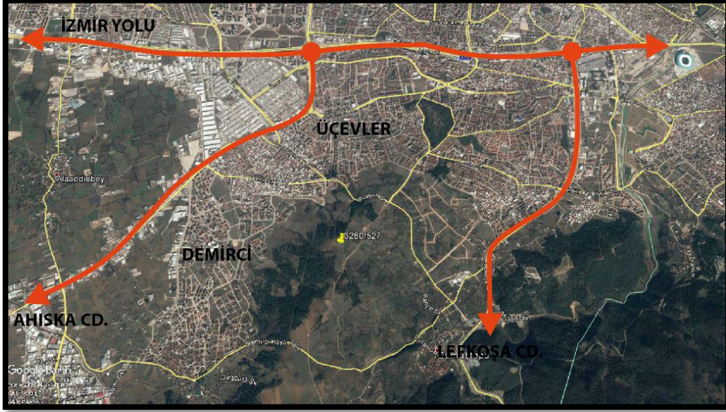
Şekil 1: Planlama Alanının Bölge İçerisindeki Konumu

Bursa İli, Nilüfer İlçesi, Demirci Mahallesi'nde bulunan 3280 ada 527 numaralı parsel Bursa İli'nin ana arterlerinden olan İzmir Yolu'nun güneyinde yer almaktadır.