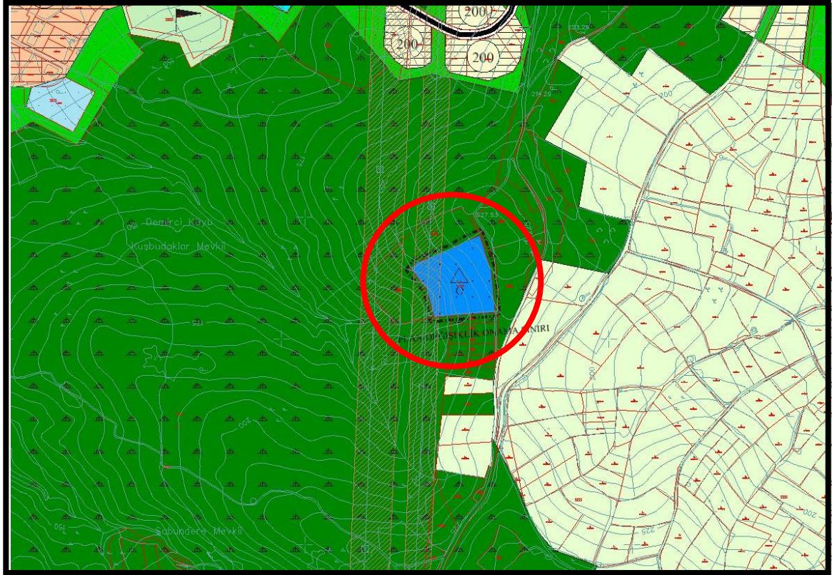
Şekil 4: 1/5000 Ölçekli Nazım İmar Planı Öneri