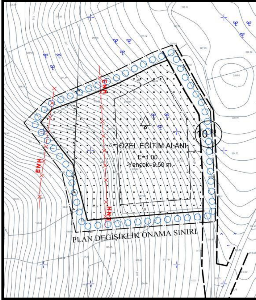
Şekil 5: 2840 Ada 8 Sayılı Parsele İlişkin 1/1000 Ölçekli Uygulama İmar Planı

İl Milli Eğitim Müdürlüğü'nün 16.06.2015 tarihinde vermiş olduğu görüşte; parselin Özel Eğitim Tesis Alanı olarak kullanılacak olması uygun görülmüştür.