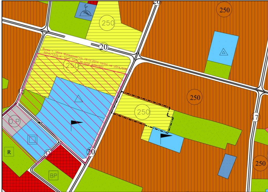
Onaylı 1/5000 Ölçekli Nazım İmar Planı Durumu

Planlama Alanı 1/5000 Plan Durumu: Osmangazi Belediyesi 1/5000 Ölçekli Nazım İmar Planında plan değişikliğine konu alan "250 ki/ha Orta Yoğunlukta Öneri Konut Alanı" olarak planlı durumdadır.