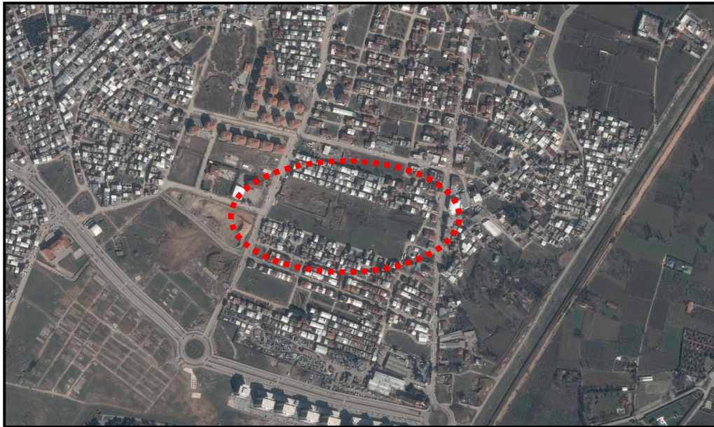
Plan Değişikliğine Konu Alanın Uydu Görüntüsü

Söz konusu alanın yakın çevresi arazi kullanımına bakıldığında ağırlıklı olarak konut kullanımlı alanların ağırlıkta olduğu görülmektedir.