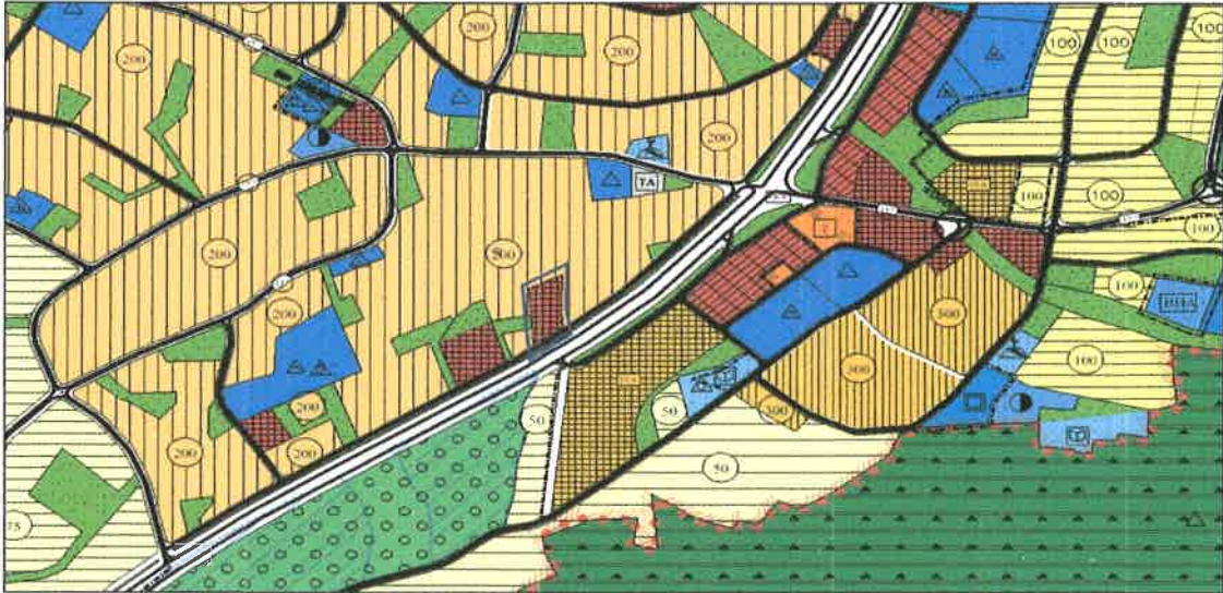
NAZIM İMAR PLANI

1/5000 Ölçekli Nazım İmar Planı: Konu parsel 1/5000 Ölçekli Nilüfer Nazım İmar Planı Kapsamında, Ticaret Alanı olarak Öngörülen Bölgede yer almaktadır. Yakın bölgesinde düşük ve orta yoğunluklu konut alanları, özel ve kamuya ait eğitim alanları, 40 m lik genişlikte ana arterler ve toptan satış yapan ticari faaliyet lekeleri yer almaktadır.