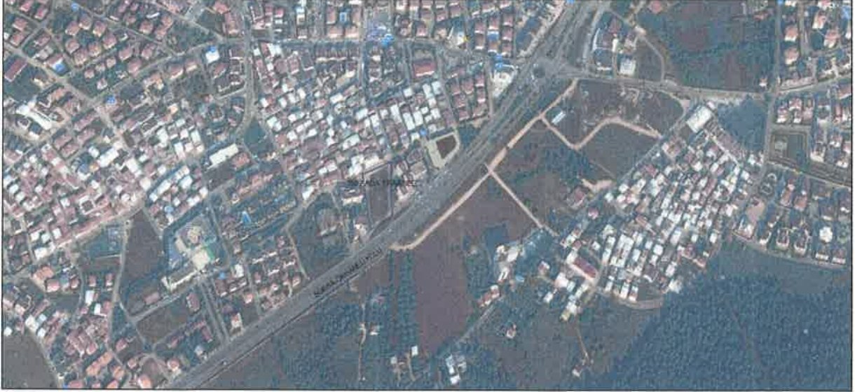
PLANLAMA PARSELİ HAVA FOTOĞRAFI

Planlama Alanı Genel Özellikler: Planlama alanı 3902 ada 1 parsel Nilüfer Belediyesi yetki sınırlarında yer almaktadır. Konu parsel tapusunda 3240.70 m 2 yüz ölçümüne sahiptir. Yakın bölgesinde betonarme strüktürde inşa edilmiş 2-5 katlı kapalı konut sisteminde yapılmış meskenler ile eğitim birimleri, teşhir alanları ve park alanlar yer almaktadır. Bursa merkezden Orhaneli ilçesine giden 40 m lik yola 10 m mesafede yer almaktadır. Bursa-İzmir Yoluna 2.2 km, Carfoursa Alışveriş merkezine 2.1 km, Şehir Stadyumuna yaklaşık 2.8 km kuş uçuşu mesafede yer almaktadır. Bölgede yapılaşmaya uygun boş parsel yok denecek kadar az durumdadır. Bölge sakinleri üst gelir grubunda yer alan kişilerdir. Bölgede oldukça yoğun araç trafiği görülmektedir.