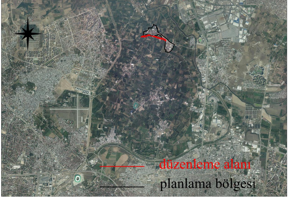
Şekil.1.Planlama Alanı Uydu Görüntüsü 2016

Yeniceabat Mahalle Muhtarlığı ve bölge sakinlerinin dilekçesi ile; Osmangazi İlçesi, Yeniceabat Mahallesi güneyinden geçen 12 metrelik bağlantı yolunun revizyonuna ait Büyükşehir Belediye Meclisi'nin 28.12.2016 tarih ve 2863 sayılı kararı ile onaylanan 1/1.000 ölçekli uygulama imar plan değişiklikleri neticesinde oluşan mağduriyetlerin giderilmesi için revizyon öncesi haline geri dönülmesi hususlarında gereğinin talep edildiği belirlenmiş ve bu kapsamda da, mevcut 1/1.000 ölçekli Uygulama İmar planında ilgili güzergaha ait 1/1.000 ölçekli Uygulama İmar Plan değişiklikleri yapılmıştır.