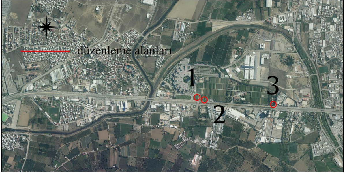
Şekil.1. düzenlemelerin konumlarına ait Uydu Görüntüsü 2016

Raylı Sistemler Şube Müdürlüğü' nün 02.05.2017 gün ve 73820 sayılı yazısı ile; Büyükşehir Belediye Meclisi'nin 19.01.2017 tarih ve 44 sayılı kararı ile plan değişiklikleri onaylanan TEDAŞ trafo yerlerinden Orman Bölge Müdürlüğü'nün alanı içerisinde kalan 2 adet trafo yerinin yol kenarına yapılacak istinat duvarlarının trafo binalarına ulaşımı engellemesi nedeniyle gerekli plan değişikliklerinin yapılması talep edilmektedir. Yanı sıra önceki düzenleme (BŞBMK 19.01.2017 tarih ve 44 sayı) ile onaylı trafo alanları ve yeşil alan düzenlemelerinin yine aynı sahada yapılan bir başka düzenleme ile kaldırıldığı yada düzenleme öncesi hali (trafo) ile onaylandığı tespitleri yapılmış ve Raylı Sistemler Şube Müdürlüğü' nce talep edilen ilgili trafo yerleri ile birlikte yeşil alan düzenlemesi ait mevcut planlarda 1/1.000 ölçekli Uygulama İmar plan değişiklikleri yapılmıştır.