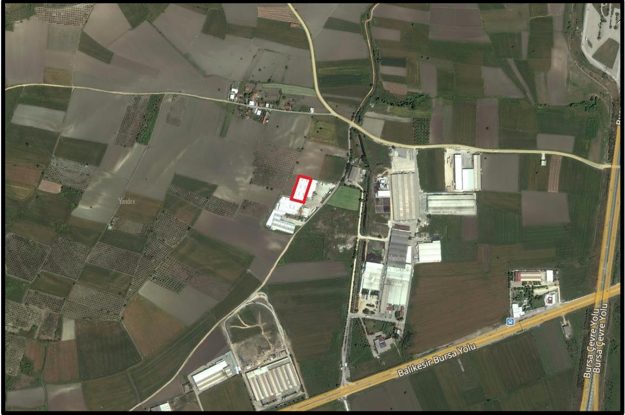
Şekil 2: Planlama Alanının Ulaşım İlişkileri