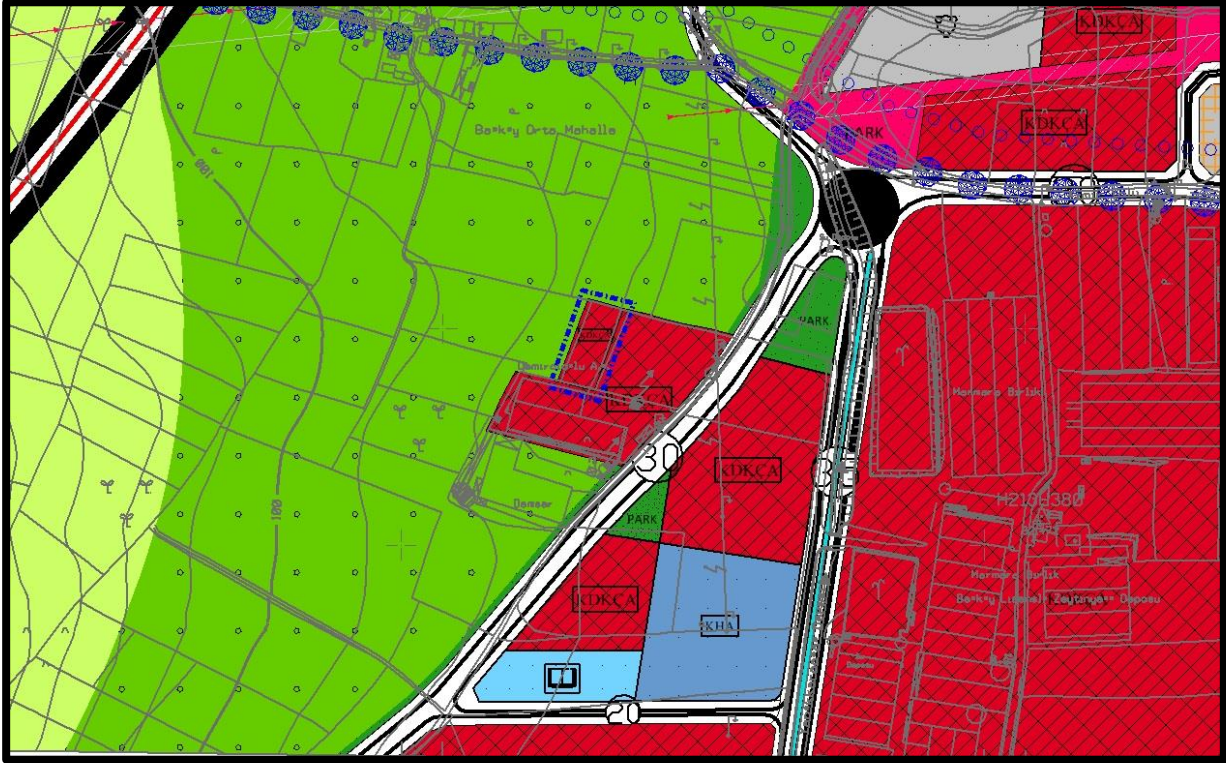
Şekil 5: 184 numaralı parsel ile ilgili 1/5000 Ölçekli Nazım İmar Planı Tadilatı