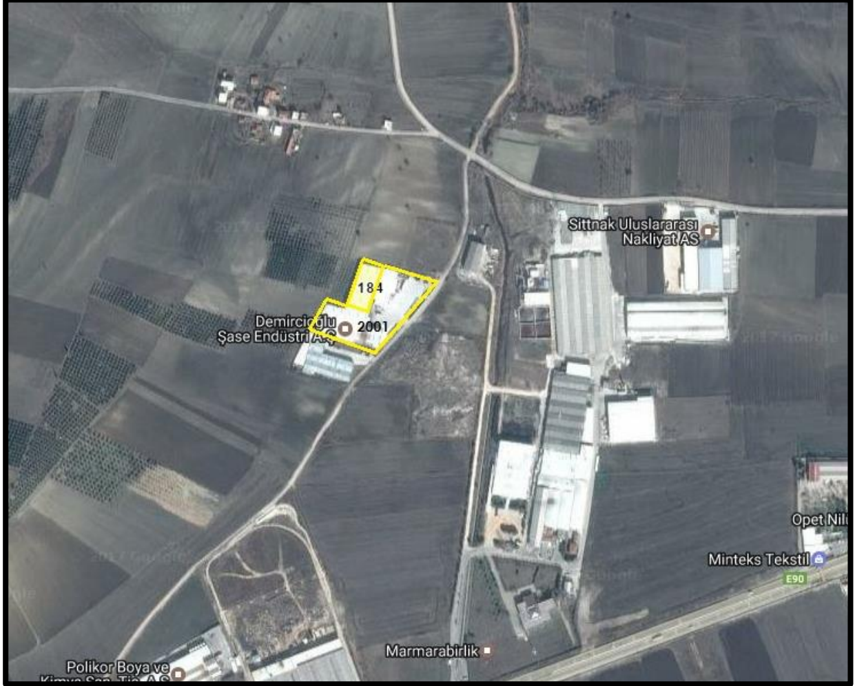
Şekil 1: Planlama Alanının Bölge İçerisindeki Konumu

Bursa İli, Nilüfer İlçesi, Başköy Mahallesinde bulunan yaklaşık 2350 m 2 büyüklüğünde olan planlama alanı yakın çevresinde Konut Dışı Kentsel Çalışma alanı bulunmaktadır.