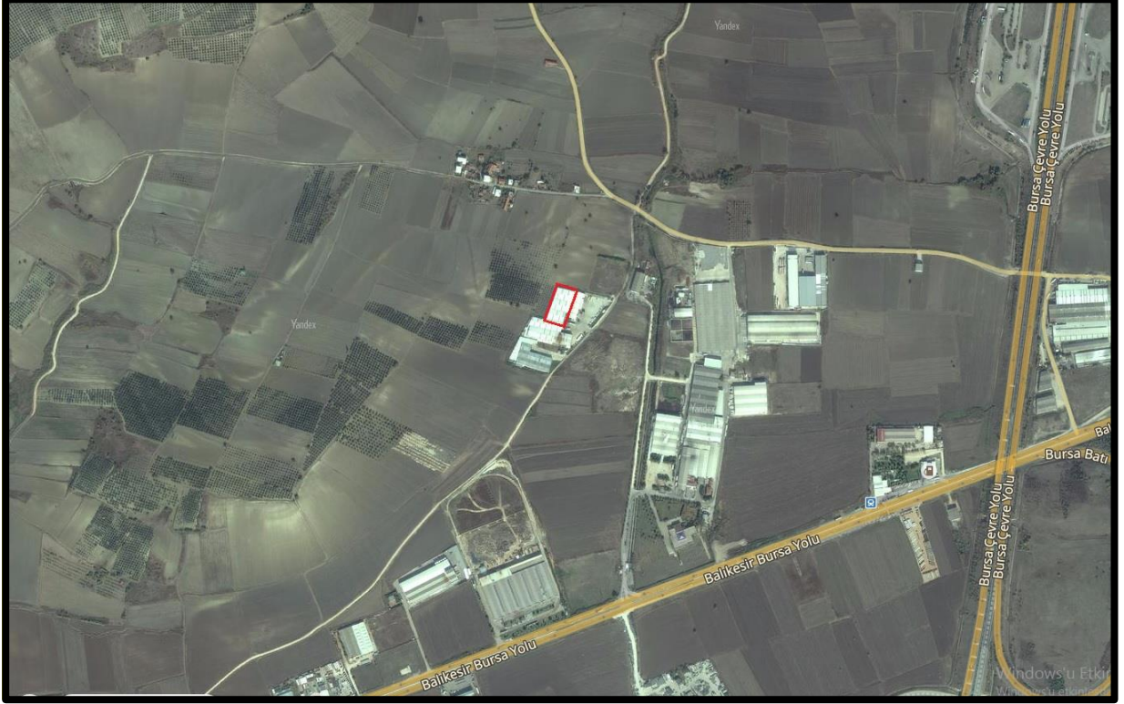
Şekil 2: Planlama Alanının Ulaşım İlişkileri