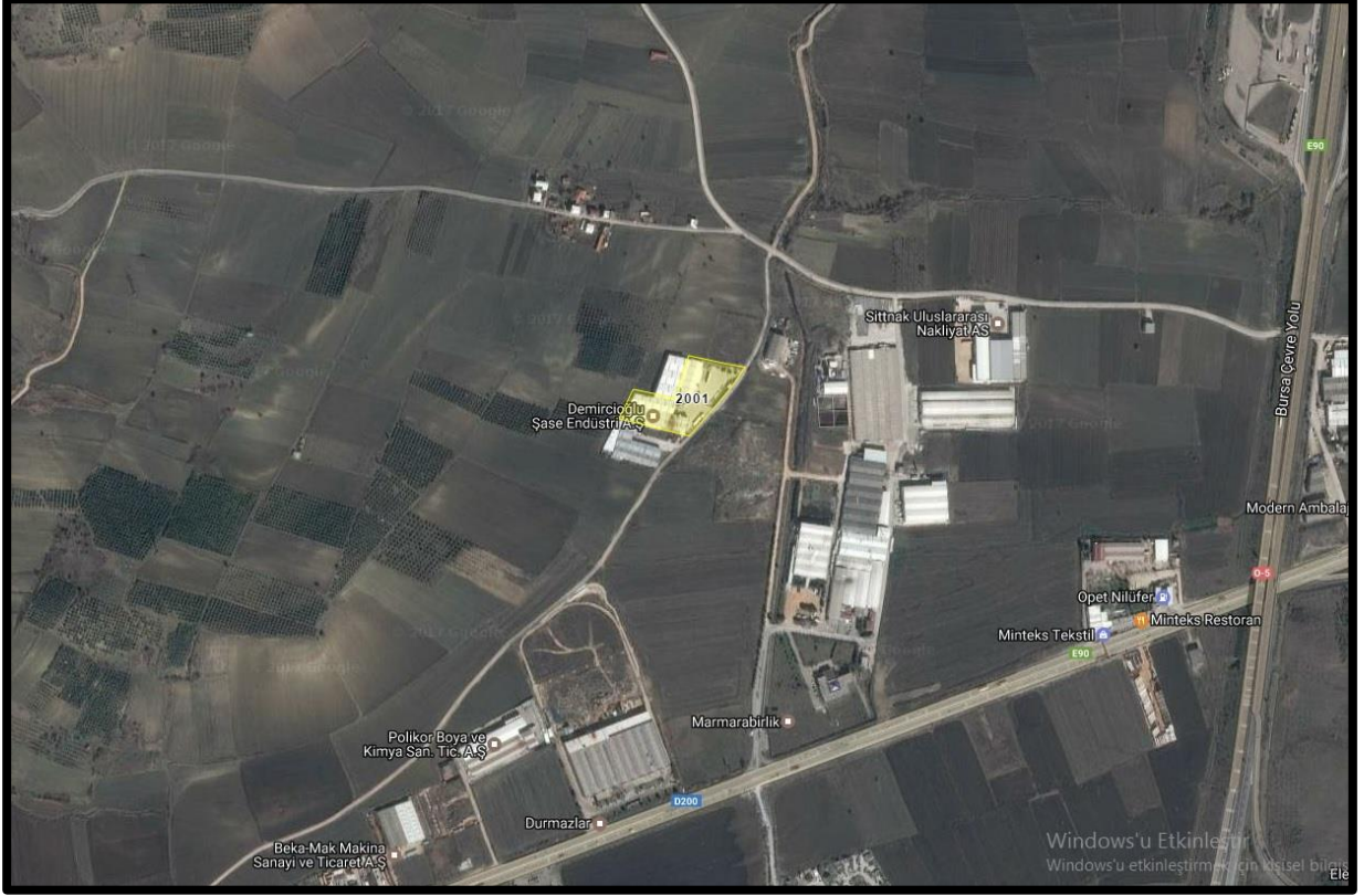
Şekil 2: Planlama Alanının Ulaşım İlişkileri