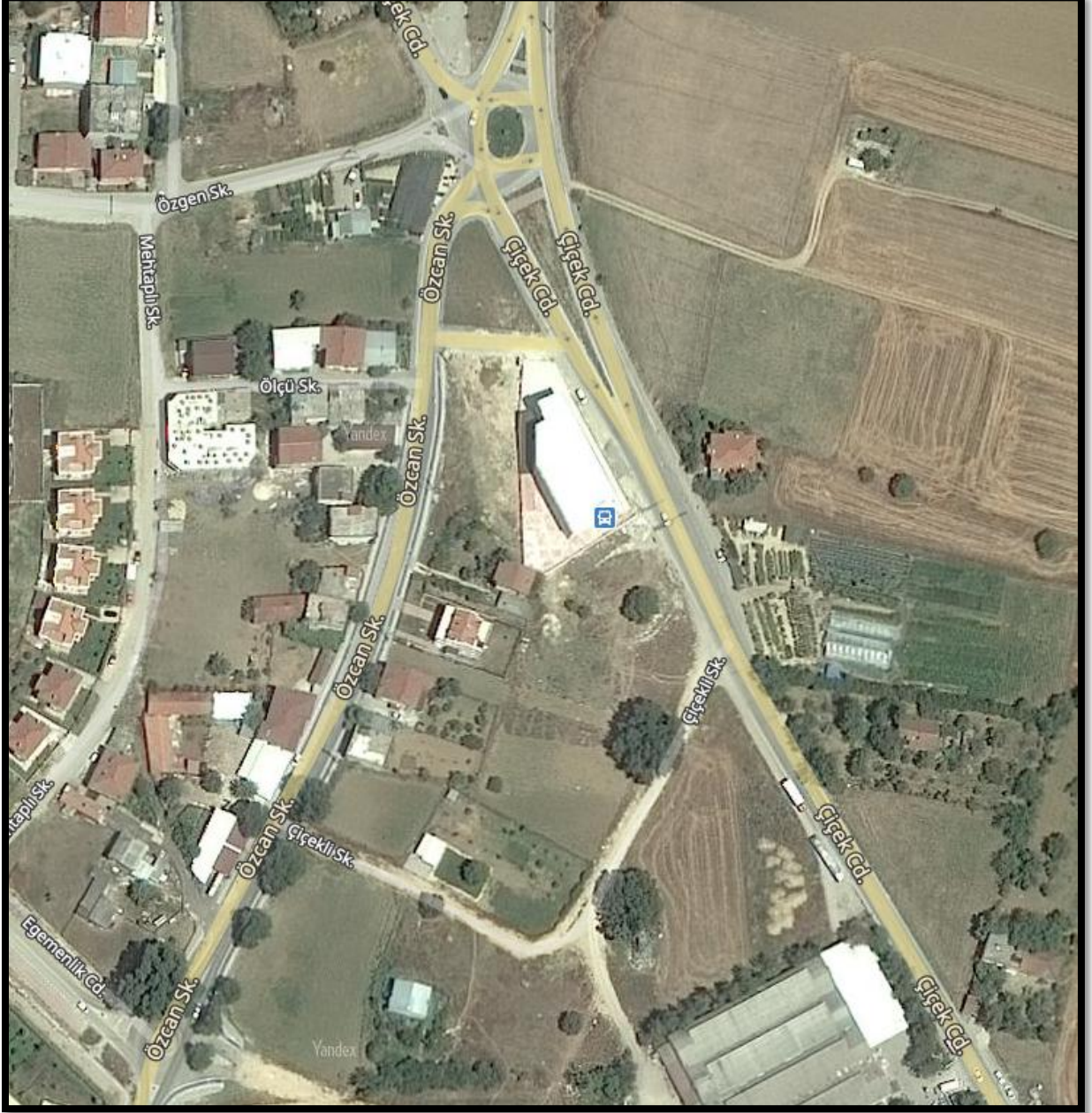
Şekil 1. 4613 Ada 3-12-13-14 Parseller Uydu Görüntüsü

1/5000 ölçekli Nazım İmar Planı Değişikliği' ne konu alan, Bursa İli, Nilüfer İlçesi, Özlüce Mahallesi, 4613 ada 3-12-13-14 parsellerdir.