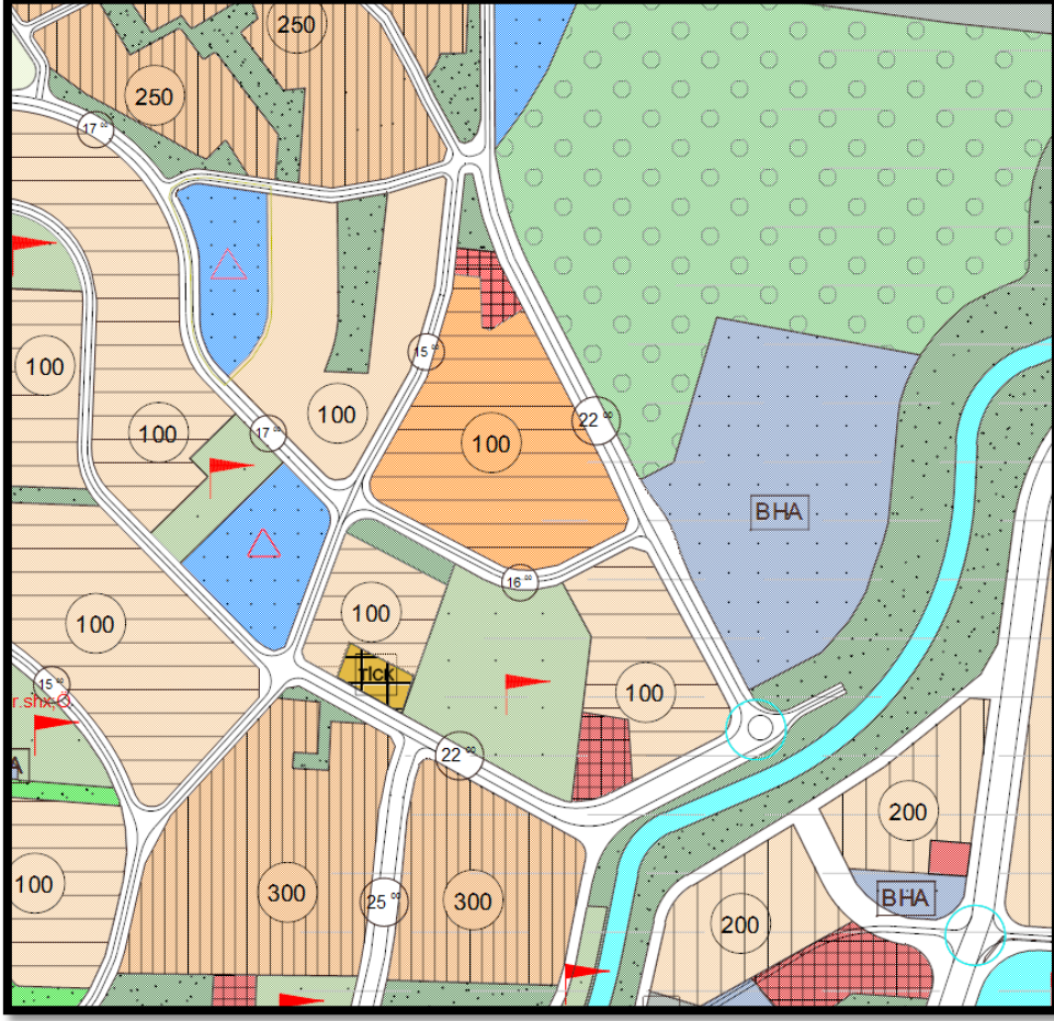
Şekil 2. 4613 Ada 3-12-13-14 Parsellerin Mevcut Durumu