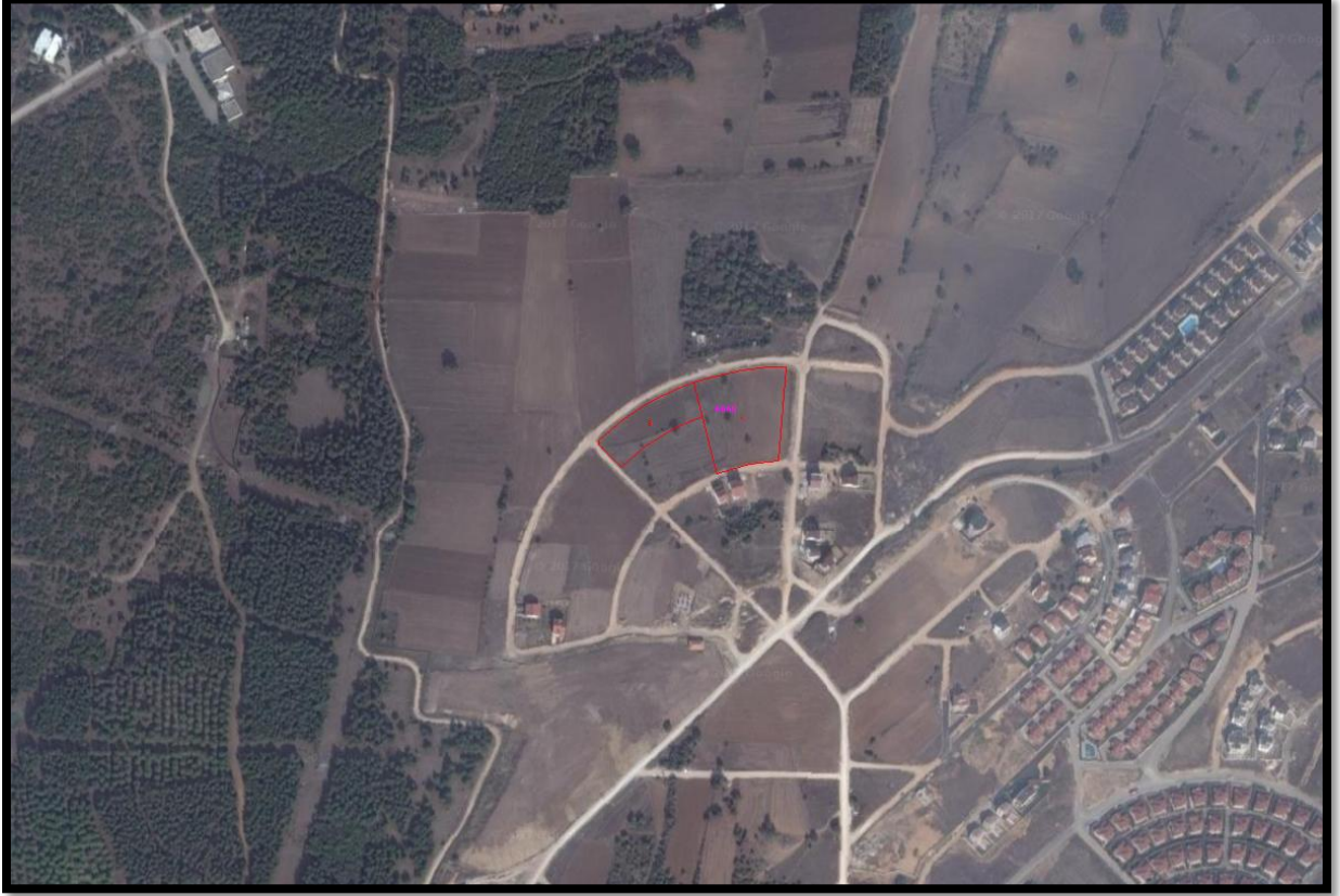
Şekil 1. 4448 Ada 1 - 2 - 5 Parsellerin Uydu Görüntüsü

1/5000 ölçekli Nazım İmar Planı Değişikliği' ne konu alan, Bursa İli, Nilüfer İlçesi, Özlüce Mahallesi, 4448 ada 1,2 ve 5 parselleridir.