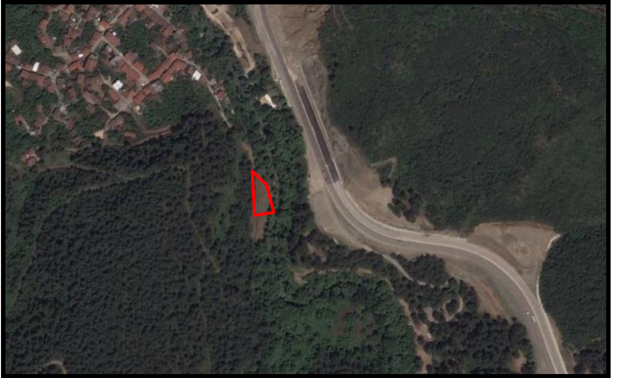
PARSELE AİT UYDU GÖRÜNTÜSÜ