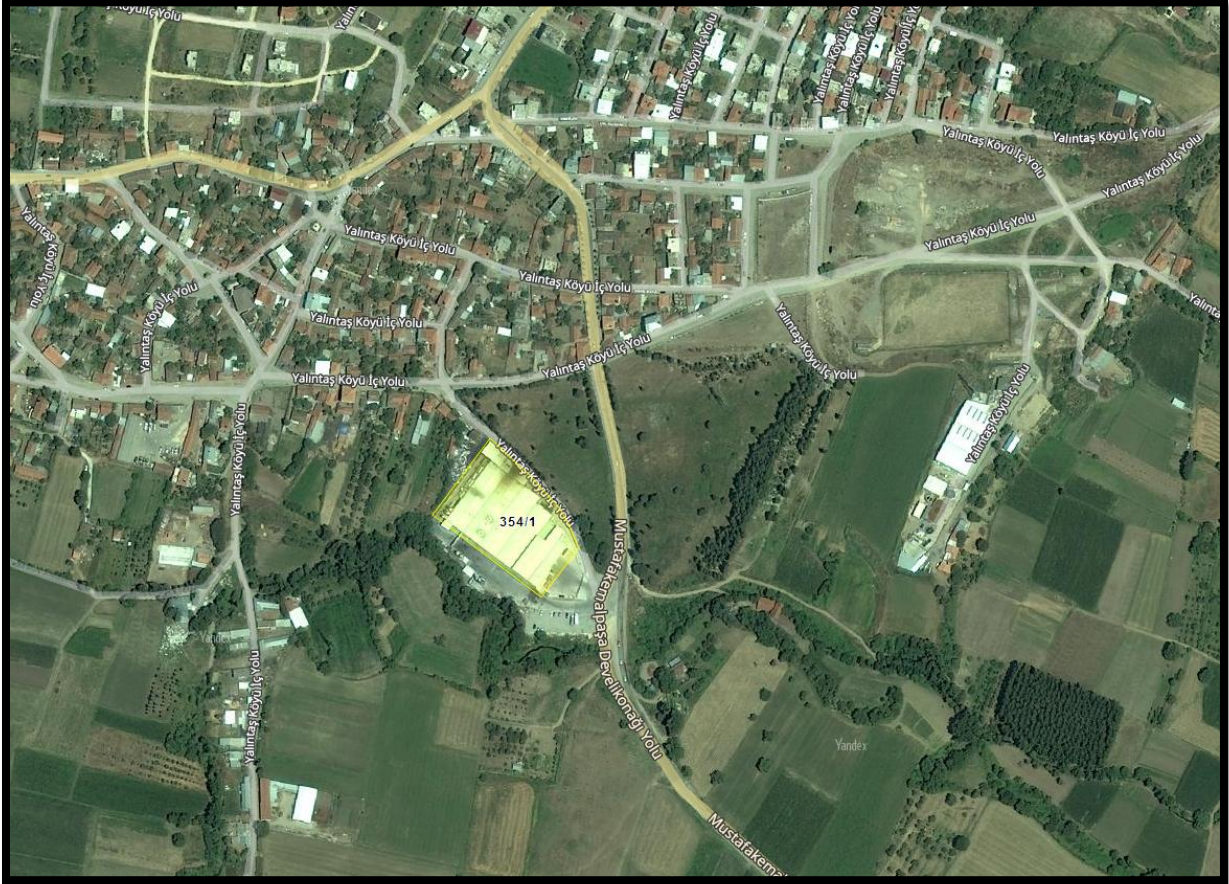
Şekil 1. 354 Ada 1Parsel ve 1547 Parsellerin Uydu Görüntüsü

1/5000 ölçekli Nazım İmar Planı Değişikliği' ne konu alan, Bursa İli, Mustafakemalpaşa İlçesi, Yalıntaş Mahallesi, 354 ada 1parcel ve 1547 parsellerdir.