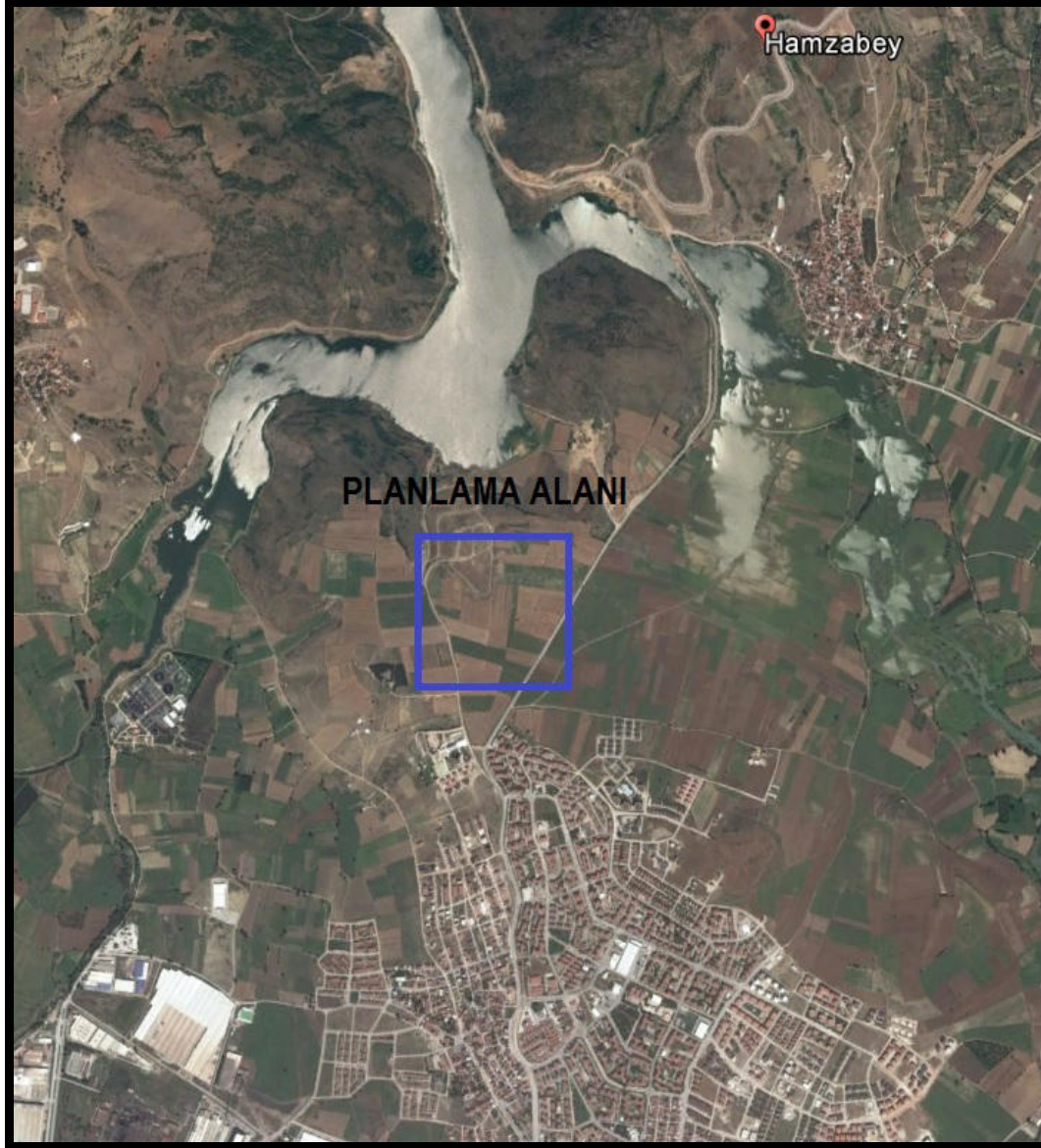
Şekil 1: Planlama Alanının Bölge İçerisindeki Konumu

Bursa İli, İnegöl İlçesi, Hamzabey Mahallesinde bulunan yaklaşık 88488.74 m 2 büyüklüğünde olan planlama alanı yakın çevresinde tarım alanları bulunmaktadır.