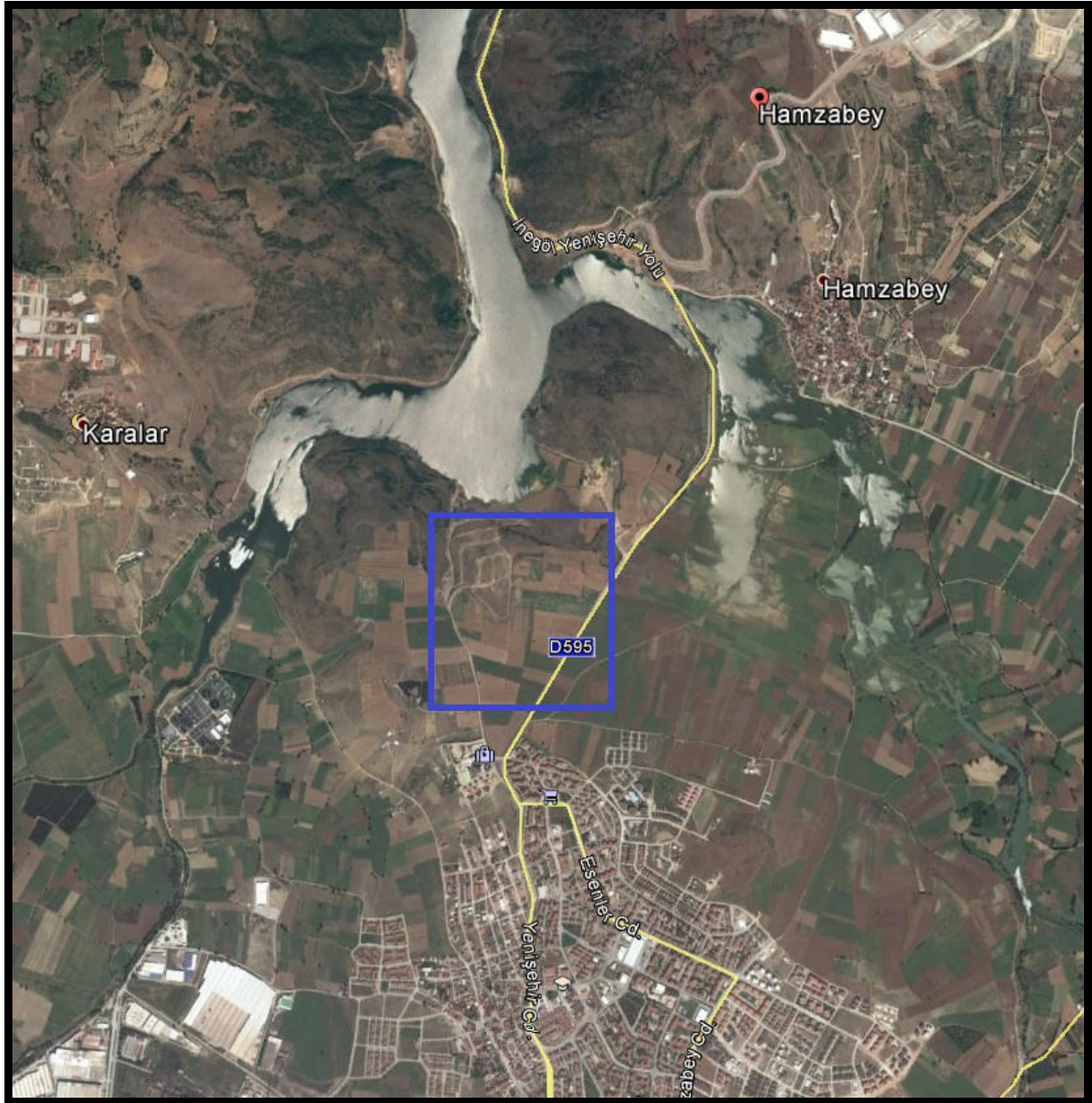
Şekil 2:Planlama Alanının Ulaşım İlişkileri