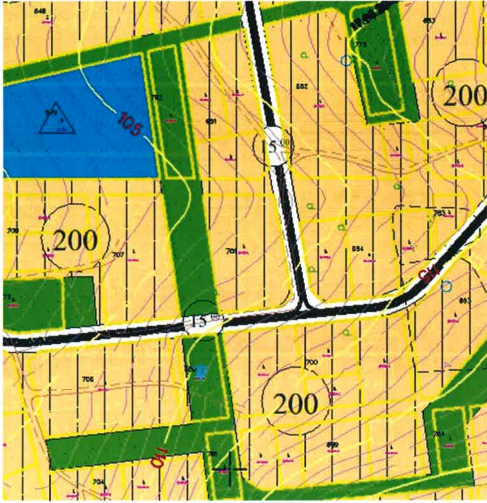
1/5000 ölçekli Nazım İmar Planı Durumu