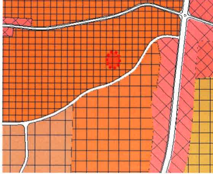
Yürürlükteki Merkez Planlama Bölgesi Nazım İmar Planı Plan Örneği