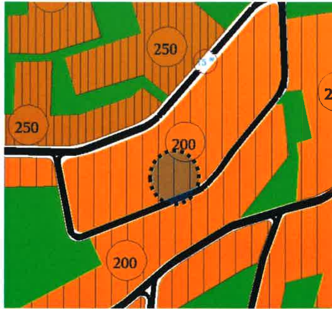
Yürürlükteki Nilüfer Nazım İmar Planı Plan Örneği