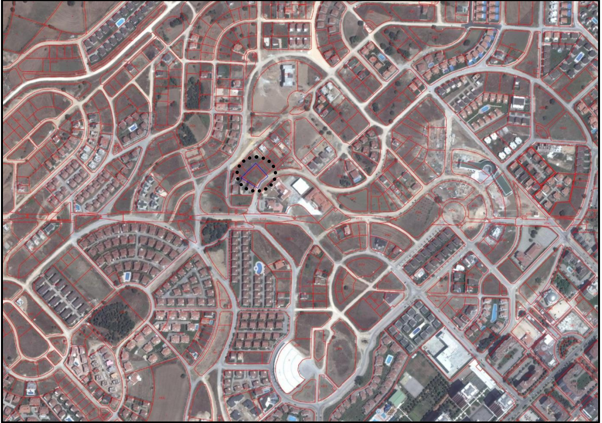
Plan Değişikliği Hazırlanan Alan

Özlüce Mahallesi Bursa Merkezinin batısında, Nilüfer Belediye sınırları içerisinde yer almaktadır. Değişikliğe konu parsel konumu itibariyle, Yüzüncüyıl Metro İstasyonun 970 m kuzeyinde, Ahmet Taner Kışlalı Bulvarının 1,4 km batısında yer almaktadır. 4539 ada 17 parsel 1000,00 m 2 büyüklüğünde, plan değişikliğine konu olan alan ise 1098,55 m 2 dir.