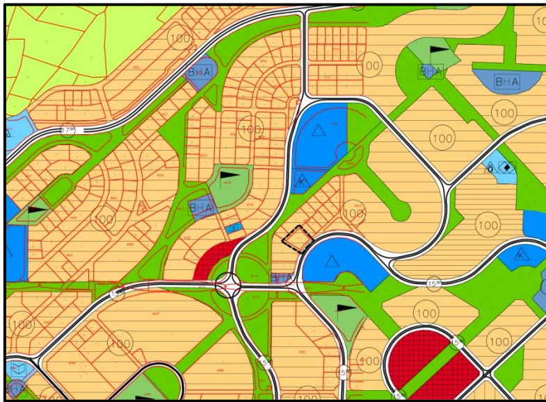
Onaylı 1/5000 Ölçekli Nazım İmar Planı