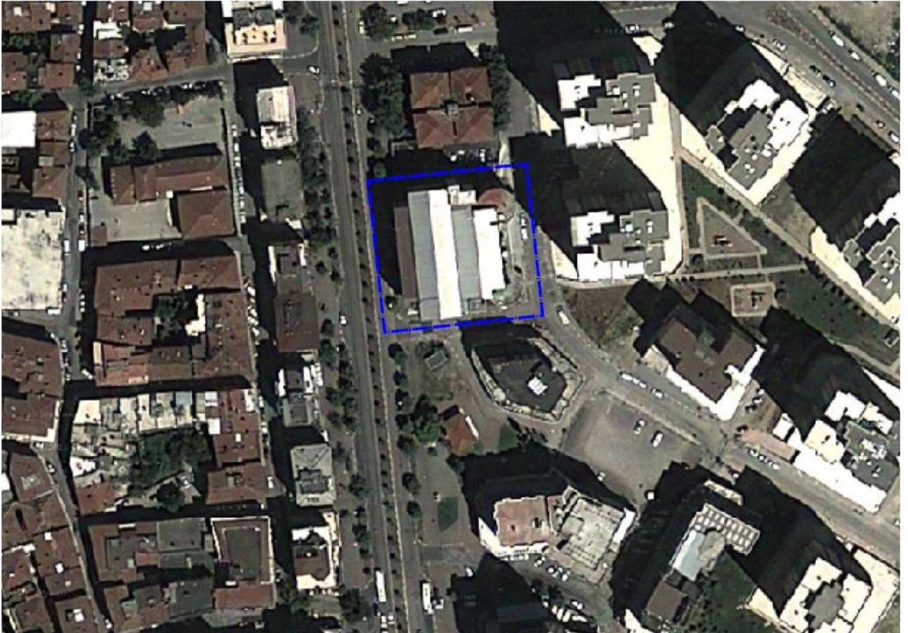
Resim 1: Alana ilişkin uydu görüntüsü

Plan değişikliğine konu alan yaklaşık 2115 m 2 olup, parselin büyük hisse oranı Büyükşehir Belediyesine ait iken diğer kalan hisseler ise özel mülkiyete aittir. Söz konusu alan Osmangazi İlçesi, Doğanbey Mahallesinde, Şehreküstü Metro İstasyonunun 200 mt. kuzeyinde, Fevzi Çakmak Caddesine üzerinde yer almakta olup, İstiklal İlköğretim Okulunun 85 mt. doğusunda yer almaktadır.