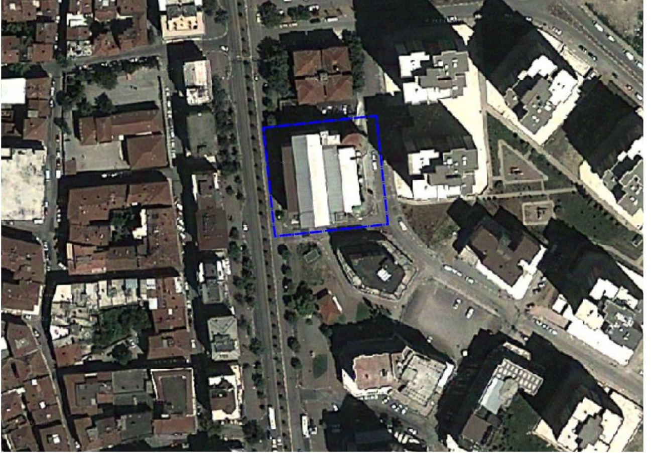
Resim 1: Alana ilişkin uydu görüntüsü

Plan değişikliğine konu alan yaklaşık 2115 m 2 olup, parselin büyük hisse oranı Büyükşehir Belediyesine ait iken diğer kalan hisseler ise özel mülkiyete aittir. Söz konusu alan Osmangazi İlçesi, Doğanbey Mahallesinde, Şehreküstü Metro İstasyonunun 200 mt. kuzeyinde, Fevzi Çakmak Caddesine üzerinde yer almakta olup, İstiklal İlköğretim Okulunun 85 mt. doğusunda yer almaktadır.