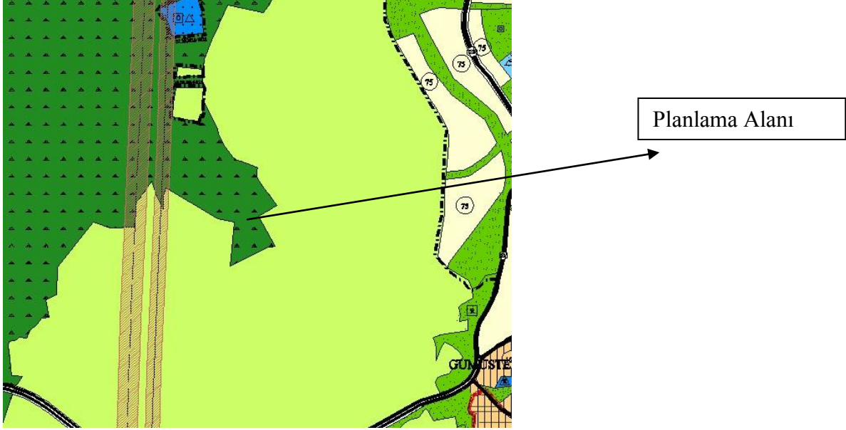
Onaylı 1/5000 ölçekli nazım imar planı

Söz konusu parseller onaylı 1/5000 Ölçekli Nilüfer Nazım İmar Planında Orman Alanında kalmaktadır.