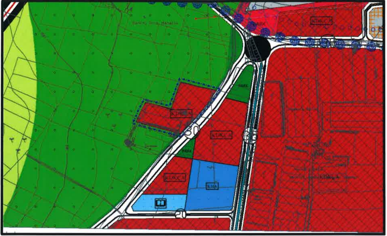
Şekil 5: 2001 numaralı parsel ile ilgili 1/5000 ölçekli Nazım İmar Planı Tadilatı