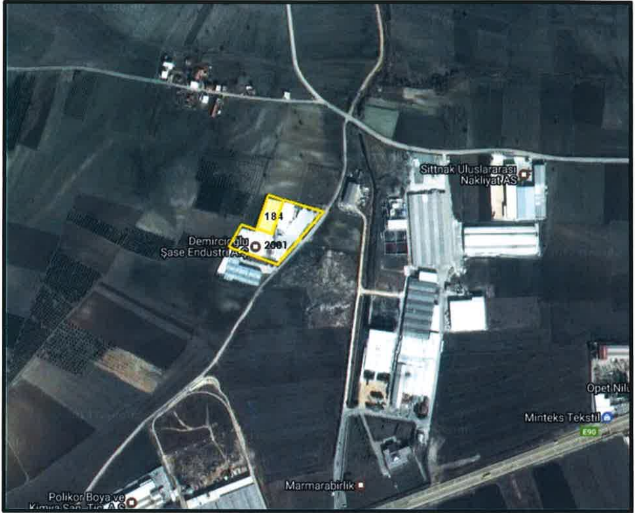
Şekil 1: Planlama Alanının Bölge İçerisindeki Konumu

Bursa İli, Nilüfer İlçesi, Başköy Mahallesi'nde bulunan yaklaşık 13425 m 2 büyüklüğünde olan planlama alanı yakın çevresinde Konut Dışı Kentsel Çalışma alanı bulunmaktadır.