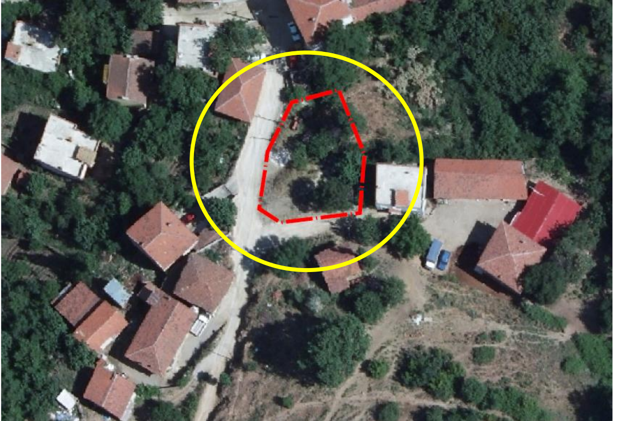
Resim 1: Alana ilişkin uydu görüntüsü

Plan değişikliğine konu alan yaklaşık 615 m 2 olup, parselin tamamı Maliye Hazinesine aittir.