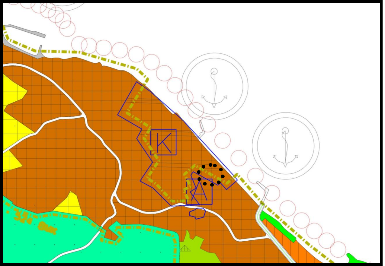
1/25000 ÖLÇEKLİ MUDANYA PLANLAMA BÖLGESİ NAZİM İMAR PLANI ÖRNEĞİ

Plan değişikliğine konu parsel Kentsel Sit Alanı içerisinde yer almaktadır.