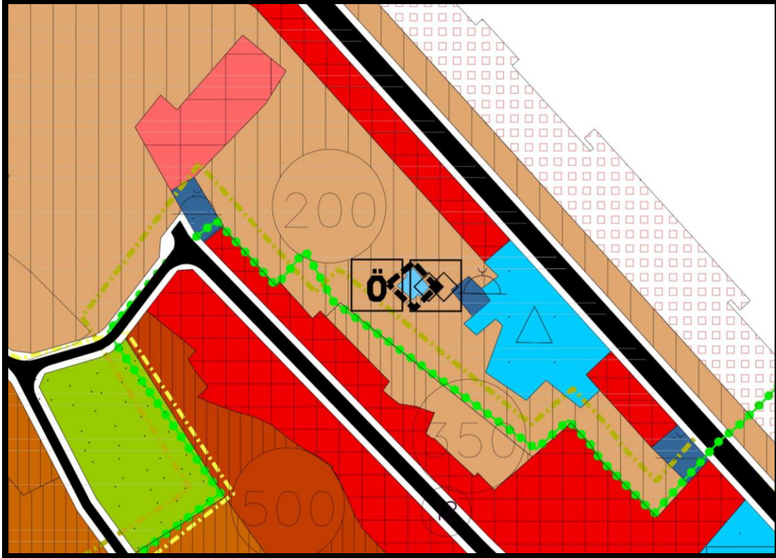
ÖNERİLEN 1/5000 ÖLÇEKLİ MUDANYA NAZİM İMAR PLANI ÖRNEĞİ