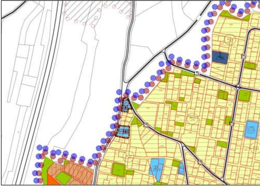
Öneri 1/5000 Ölçekli Nazım İmar Planı

Hazırlanan 1/5000 Ölçekli Nazım İmar Planında Eęitim, Saęlık Binaları ile Bakım ve Rehabilitasyon Ünitelerinin kurulması amacı ile 1-13 parsellerde 1123,89 m 2 ve 6-7-8-9 parsellerde de 2101,21 m 2 olmak üzere ayrı ayrı 2 tane Özel Sosyal Tesis Alanı düzenlenmiştir.