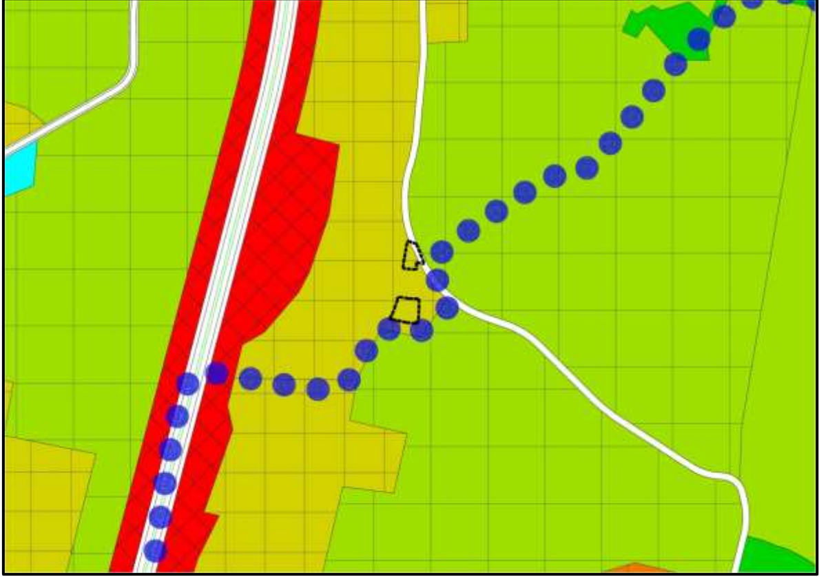
Onaylı 1/25000 Ölçekli Nazım İmar Plan