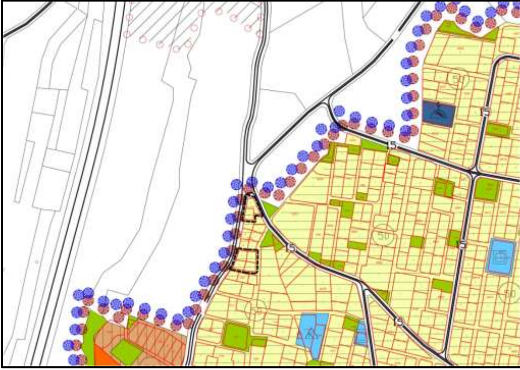
Onaylı 1/5000 Ölçekli Nazım İmar Planı