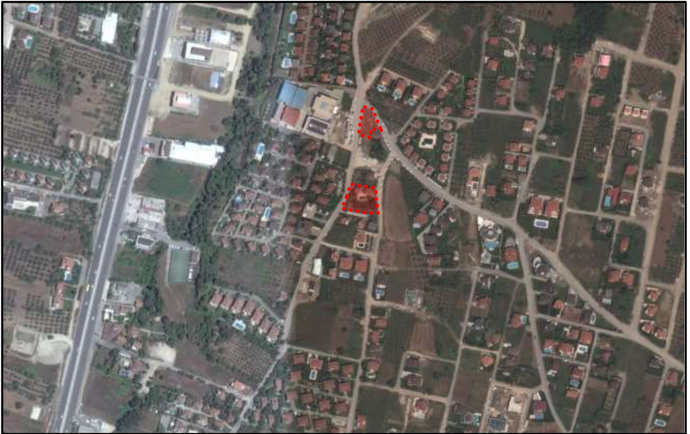
Plan Değişikliği Hazırlanan Alanın Uydu Görüntüsü

Nilüferköy Mahallesi, Bursa Merkezinin kuzeybatısında ve Osmangazi İlçesi sınırları içinde bulunmaktadır. Söz konusu alan konumu itibariyle Mudanya Yolu'nun 360 m Nilüferköy Cami'nin 1 km kuzeybatısında yer almaktadır. 10279 ada, 1 parsel 645,82 m 2 , 6 parsel 518,07 m 2 , 7 parsel 522,79 m 2 , 8 parsel 506,59 m 2 , 9 parsel 510,41 m 2 , 13 parsel 504,12 m 2 dir. Plan değişikliği hazırlanan alan 1-13 parseller toplamda 1123,89 m 2 , 6-7-8-9 parseller ise toplamda 2101,21 m 2 büyüklüğündedir. Söz konu alanda 1-13 parseller beraber, 6-7-8-9 parseller ise beraber uygulama yapılacaktır.