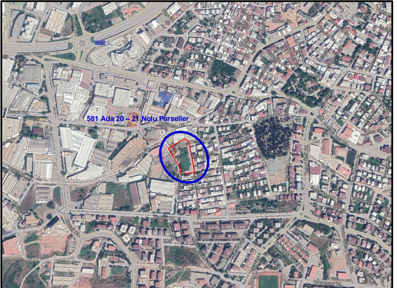
Şekil 1: Plan Değişikliğine Konu Alanın Konumu

Bursa İli, Kestel İlçesi, Ahmet Vefik Paşa Mahallesi, 581 Ada 20 – 21 Nolu Parseller; Kestel Organize Sanayi Bölgesinin doğusunda, Ankara Bulvarının yaklaşık 470 metre güneydoğusunda konumlanmıştır. Plan değişikliğine konu parseller batı yönünde Taşpınar Sokağı, doğu yönünde İnce Sokağı, güney yönünde ise Börekçi Sokağı cephelidir.