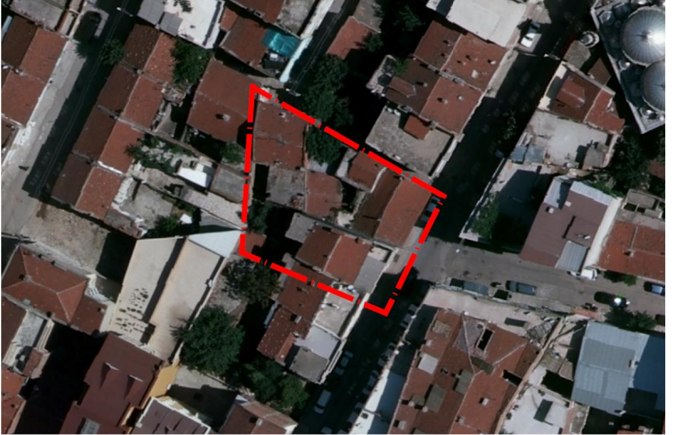
Resim 1: Alana ilişkin uydu görüntüsü

Plan değişikliğine konu alan yaklaşık 420 m 2 olup, parsel özel mülkiyetten oluşmaktadır.