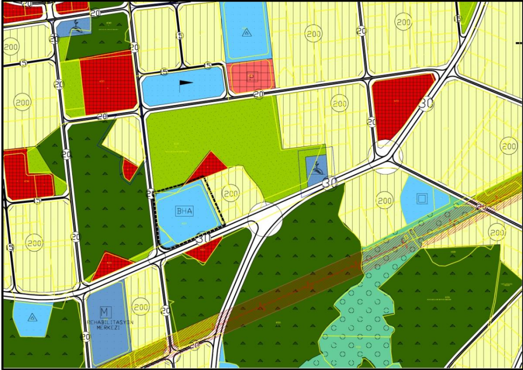
Onaylı 1/5000 Ölçekli Nazım İmar Planı