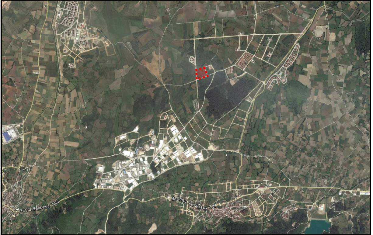
Plan Değişikliği Hazırlanan Alan

Kayapa Çamlık Mahallesi Bursa Merkezinin güneybatısında, Nilüfer Belediye sınırları içerisinde yer almaktadır. Değişikliğe konu parsel konumu itibariyle, İzmir Caddesi'nin 2,5 km güneyinde, Kayapa Sanayi Alanı'nın 810 m güneydoğusunda yer almaktadır. 6233 ada 1 parsel 19628,56 m 2 dir. Plan değişikliğine konu alan ise 24299,98 m 2 büyüklüğündedir.