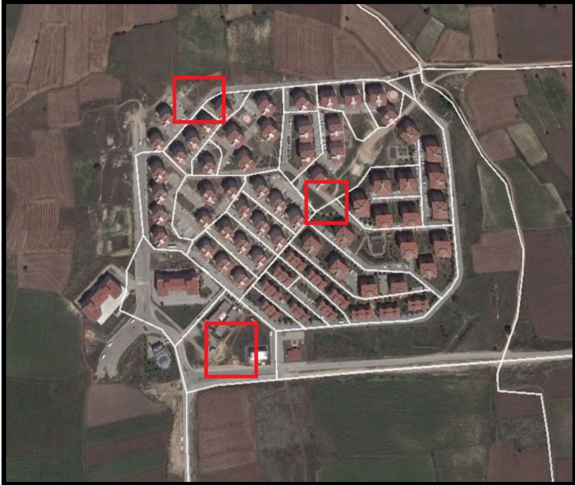
Şekil 1: Planlama Alanının Bölge İçerisindeki Konumu

Bursa İli, İnegöl İlçesi, Akhisar Mahallesi'nde bulunan yaklaşık 3340 m 2 büyüklüğünde olan planlama alanı yakın çevresinde konut, park ve donatı alanları bulunmaktadır.