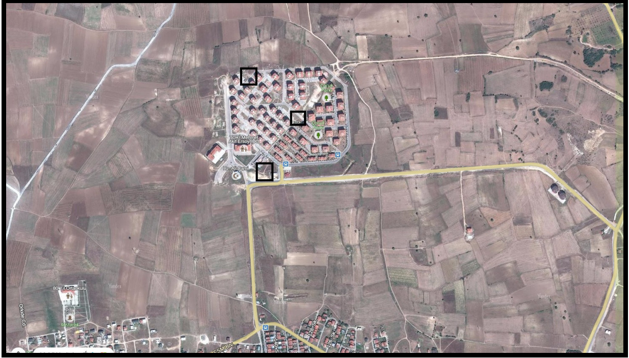
Şekil 2:Planlama Alanının Ulaşım İlişkileri