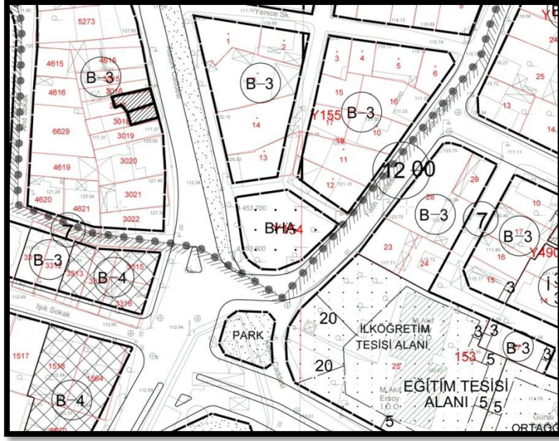
1/1000 ölçekli mevcut plan durumu